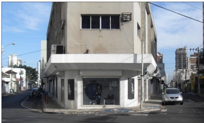
Autor, FREITAS, B., 2013.