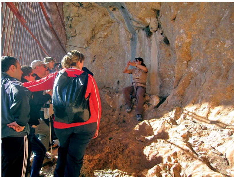
Visitas guiadas al abrigo de Mallata.

Con destino a los conjuntos anteriores se han articulado cinco itinerarios didácticos (Arpán, Mallata, Barfaluy, Regacens, Chimiachas – Quizans) que requieren una sencilla actividad senderista de diferente duración. Las rutas disponen de equipamiento señalético —señalización direccional, informativa (de la ruta, de las posibilidades de visita, de los lugares de contacto y de otros datos de interés) e interpretativa (paneles sobre el contenido de los abrigos y otros recursos del entorno)— que sigue un mismo sistema e idéntica jerarquización. Cada una de las rutas, además de centrarse en el abrigo correspondiente y en su contenido, aprovecha los recursos de su recorrido, de modo que en ellas se abordan a la vez diferentes aspectos relativos al arte rupestre, la prehistoria y el entorno. Todas las actuaciones han estado presididas por la sostenibilidad ambiental y cultural y la protección específica del patrimonio.