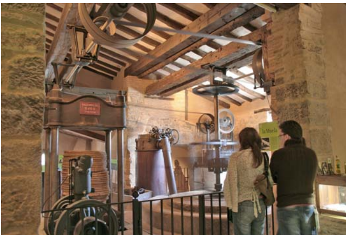
Torno de Buera.

Antiguo molino de aceite que comprende dependencias de los siglos XVII y XVIII. Fue restaurado y musealizado y se ha convertido en el centro dedicado a la cultura del aceite en el Somontano. En sus instalaciones se presenta la evolución del cultivo del olivo y la elaboración del aceite, con conexiones históricas, culturales y relacionadas con las creencias. Los elementos de la almazara, tras su recuperación, se han puesto en funcionamiento y junto a un audiovisual sirven de soporte para explicar las diferentes fases del proceso y su contexto cultural. Es punto de partida para la ruta al santuario de Nuestra Señora de Dulcis y el Bosque de los Olivos. Realiza un programa didáctico y organiza eventos diversos. Gestionado por el Ayuntamiento de Santa María de Dulcis, sus actividades están integradas con las del Parque Cultural del Río Vero.