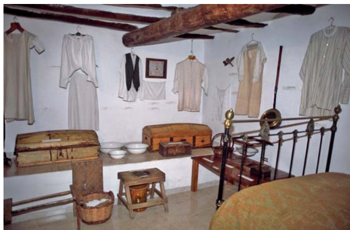
Museo Etnológico Casa Fabián, en Alquézar.

El museo está instalado en una casa somontanesa originaria del siglo xvi. En las diferentes dependencias de la casa se acondicionan los espacios característicos de la casa rural del Somontano, que a su vez ilustran las formas de vida de las gentes de la sierra de Guara y el Somontano hasta comienzos del siglo xx. Mobiliario y enseres ambientan actividades o espacios tan característicos como la cocina, la alcoba, las bodegas, el trabajo del campo, etcétera. En los bajos de la casa se encuentra un molino de aceite tallado en la roca que emerge del suelo y que puede remontarse a la Edad Media. Está gestionado por el Ayuntamiento de Alquézar y la familia propietaria del museo.