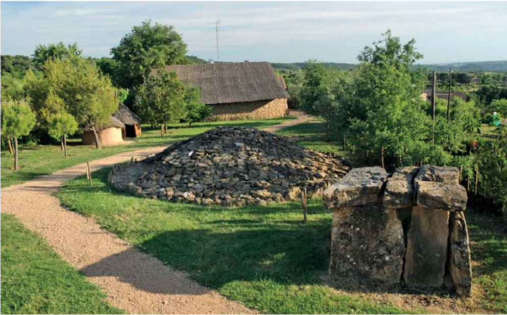
Parque Arqueológico.