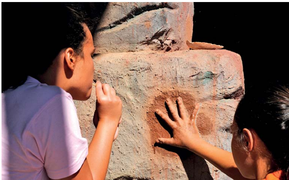
Taller de pintura prehistórica en el Centro de Arte Rupestre.