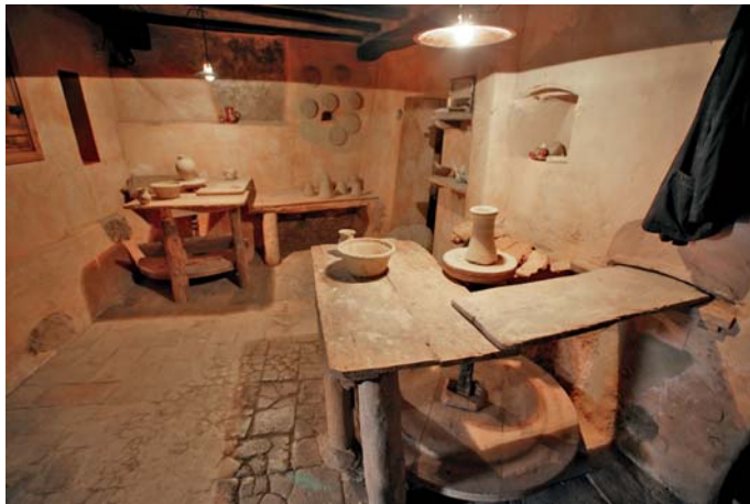
Centro de la Alfarería, en Naval. Obrador.

Naval es una localidad vinculada desde la Edad Media a la producción de cerámica y a la de sal, que en la actualidad todavía se mantienen. El centro corresponde al antiguo alfar de casa Palomera, que conserva todas sus dependencias básicas: balsas de decantación de la arcilla, obrador, horno. Ha sido completamente restaurado y musealizado y muestra, a través de cinco salas, el proceso de fabricación completo de la cerámica de Naval y la historia de la alfarería. Entre los recursos museográficos destaca un audiovisual de luz y sonido que en el obrador nos acerca a la faceta más humana del oficio de alfarero. Se complementa con la Ruta de la Sal y la actividad alfarera tradicional de la localidad. Realiza un programa didáctico y diferentes actividades que se interrelacionan con las del Parque Cultural del Río Vero.