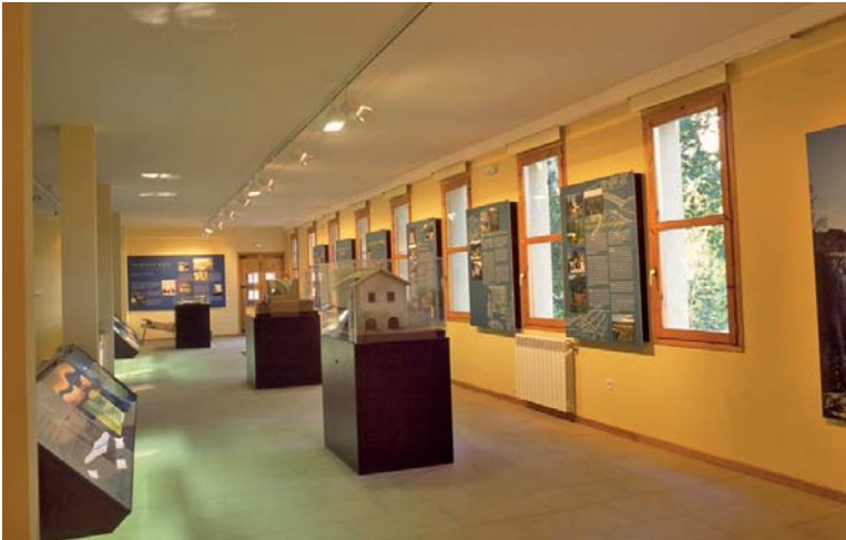
Centro de Interpretación del Río Vero, en Castillazuelo.

río Vero, así como otras rutas en el ámbito del parque. Realiza un programa didáctico y diferentes actividades, y está gestionado por la Comarca de Somontano y el Parque Cultural del Río Vero en colaboración con el Ayuntamiento de Castillazuelo.