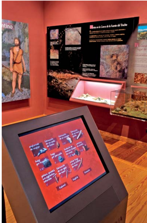
Centro de Interpretación del Arte Rupestre, en Colungo. Detalles interactivos en la primera planta.