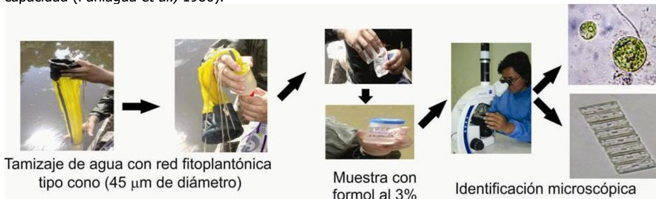
Figura 2. Flujograma del procedimiento para identificar microalgas a partir de muestras de agua.

Fueron identificadas mediante observación microscópica a 400x (CarlZeiss Axiostar plus) y en base al manual de Ettl y Gartner (1995). La densidad de las microalgas (células/ml) presentes en las muestras de agua fue realizada en base a su conteo en cámaras de Neubauer y Sedgwick-Rafter de 1 ml de capacidad (Paniagua et al. , 1986).