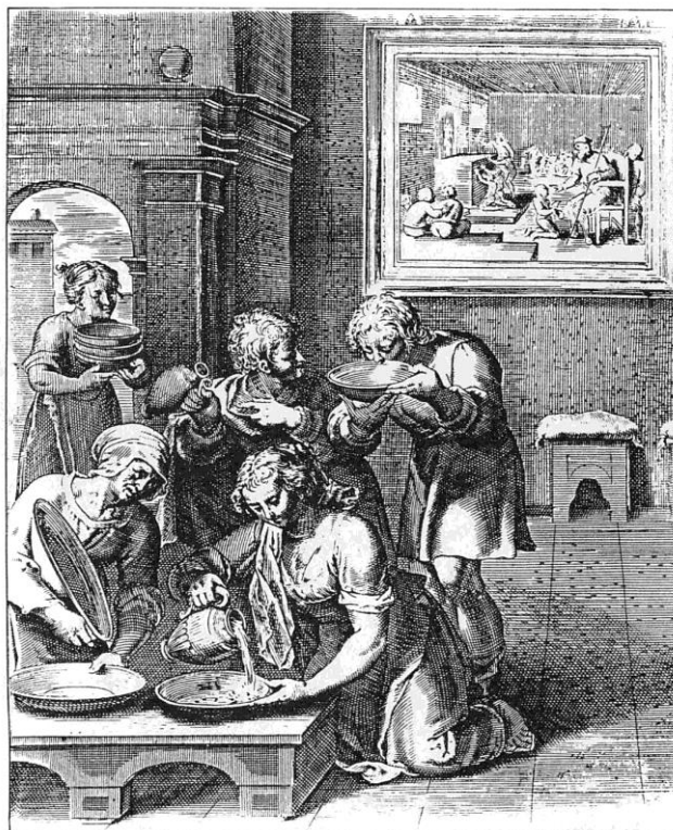
4. Vis institutionis (la fuerza de la enseñanza).