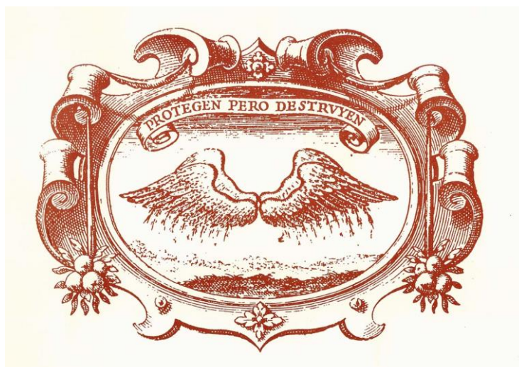
Fig. 1. Saavedra Fajardo, Empresas políticas... (empresa XCII).