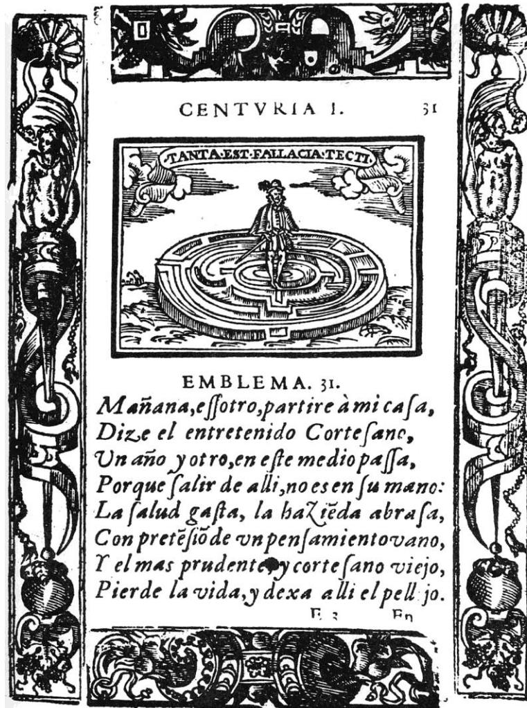
Fig. 3. Sebastião de Covarrubias, Emblemas morales (emblema XXXI).

El jesuita Jacobo Boschius (1702) muestra una análoga disposición en dos de los estupendos grabados que acompañan sus sermones con sentido positivo y negativo: en el hilo vence el engaño; el error es inextricable.