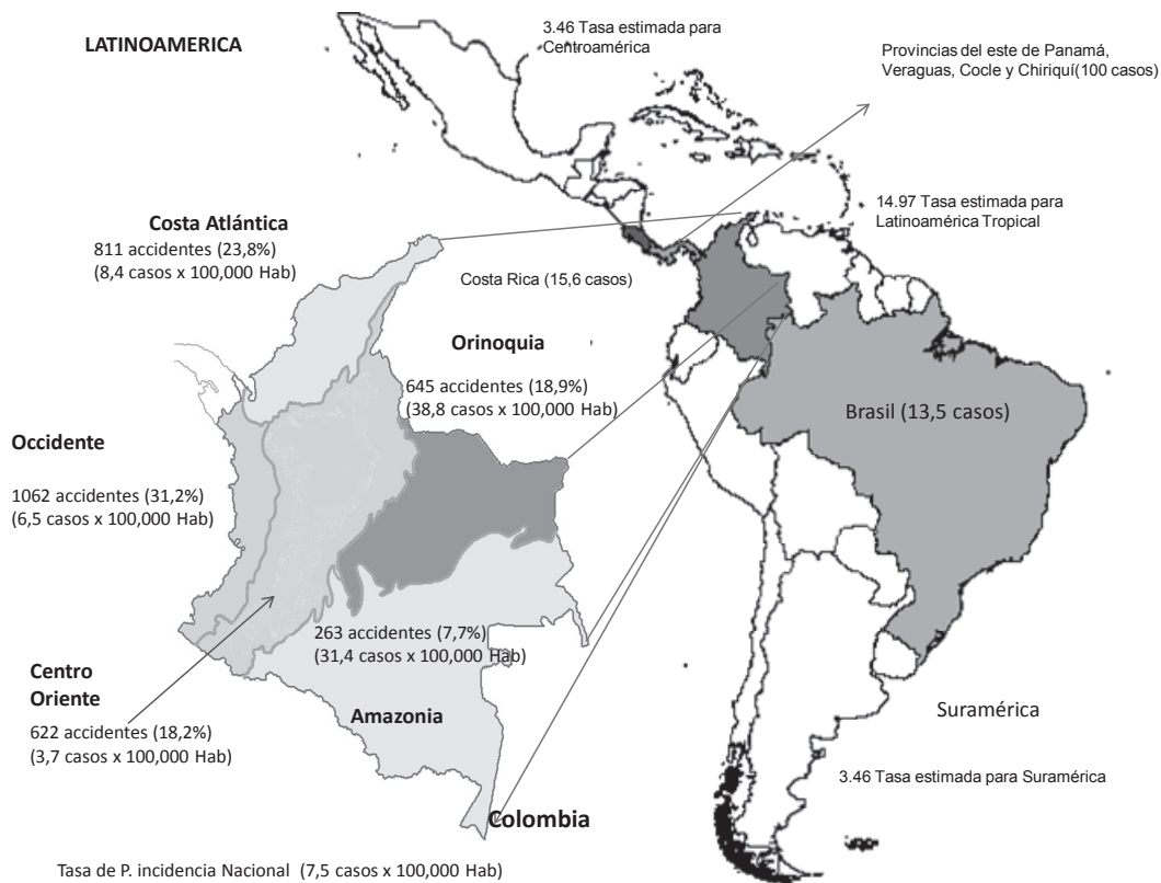
Figura 2. Proporción de incidencia de accidente ofídico para América latina (número de casos por 100.000 habitantes/por año)

En el 2010, en su informe anual sobre accidente ofídico en Colombia, el Instituto Nacional de Salud (INS) reportó que hasta el décimo tercer periodo epidemiológico del 2009 hubo un total de 3.405 casos comprobados de accidente ofídico. Por municipios, 553 de 1.119 resultaron afectados (49,4%), lo que da una idea de la magnitud del evento [31]. El INS reportó que la proporción de incidencia nacional por 100.000 habitantes es de 7,5 casos; por región geográfica, la mayor incidencia ocurre en la Amazonia (31,4 casos por 100.000 habitantes) y la Orinoquía (38,8 casos por 100.000 habitantes) (figura 2) [31].