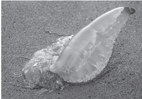
Figura 4. Invertebrado causante de accidentes ocupacionales ( Physalia physalis )

tas y pescadores en las costas (figura 4). Haddad reporta en el 2002 en el suroeste de las costas de Brasil (Ubatuba), en un periodo de observación entre de 1997 y junio de 1998, enero de 1999 a junio del 2000 y en el 2001 un total de 49 casos, presentados entre hombres 32/49 (65,3%). Este mismo autor reporta brotes de P. physalis † ocurridos en Guaruja (200 km al sur de Ubatuba), con casi 300 picaduras en 1994 [57]. En Colombia se conoce su presencia en sus costas pacífica y atlántica. Todos los años hay casos en bañistas y pescadores, pero su casuística es casi nula (el subregistro es casi que total), por lo que no se sabe de su impacto ni humano ni laboral (figura 4).