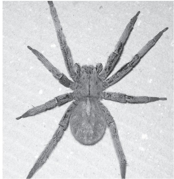
a) Phoneutria spp (araña de las bananeras) es la araña de mayor importancia en recolectores de banano, palma africana y frutales de zonas cálidas a templadas en Colombia.

Las arañas del infraorden Mygalomorphae, también conocidas como tarántulas o arañas polleras, son de cuerpo veloso y pueden alcanzar hasta 25 cm de longitud total. El envenenamiento causado por la mordedura de estas arañas solo provoca síntomas locales como dolor, edema, eritema y, a veces infarto ganglionar (figura 3). Otro grupo de arañas importantes por su amplia distribución geográfica y por el número de accidentes que se observan en los servicios médicos son los causados por el género Lycosa , de frecuente presencia en los jardines; de hecho, muchos de los accidentes que se le atribuyen a Phoneutria realmente los causa este tipo de arañas, pero en caso de mordedura, al igual que con las tarántulas [28], el tratamiento se reduce a la administración de analgésicos [48]; sin embargo, hay que tenerlas en cuenta al momento de determinar incapacidad en salud ocupacional.