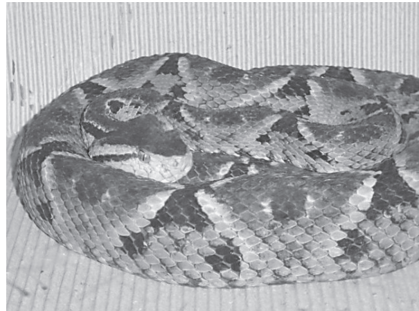
A) La Bothrops asper (mapaná x) causa entre el 80% y 90% de la accidentalidad del país.

en cafetales y cultivos de frutas, como cítricos y palma africana, pero dada su mediana toxicidad, puede ser relativamente alto el subregistro de la casuística por esta especie (figura 1). De las 300 especies de serpientes que hay en Colombia, menos del 15% son venenosas, sus ataques casi siempre afectan a trabajadores agropecuarios (60-90%) [26].