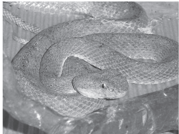
B) La Bothriechis schlegelii (víbora de tierra fría o cafetal) causa accidentes en recolectores de café y de cultivos de frutas, pero su toxicidad se considerada de mediana a baja.