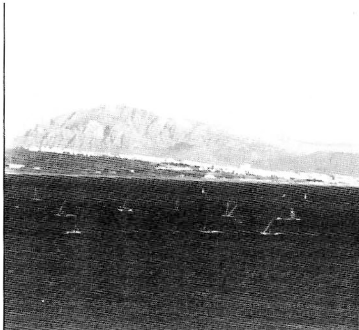
Practica del windsurfing en las costas tarilenas. (Foto M. Rojas).