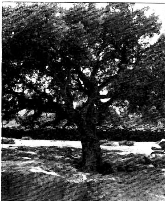
Parque Natural de los Alcornocales en el término de Tarifa.

Contamos en nuestro término municipal con dos Reservas Naturales, la de la playa de Los Lances a dos kilómetros de Tarifa hacia el noroeste, cuyo acceso es por la nacional 340, en el kilómetro 79 por el Camping Río Jara y en el kilómetro 82 por la