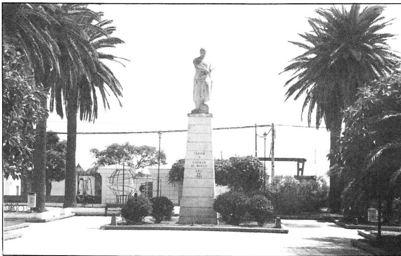
Guzmán el Bueno, al que Baroja llamó "fantasma de Tarifa".

produjo la ciudad en su conjunto, sus costumbres, su historia, su leyenda... Más dado a su paisaje vasco a al castellano, y poco entusiasta de todo lo meridional, Baroja se deja deslumbrar por el aspecto que le ofrece la ciudad: Por la mañana, con un sol radiante, veo la ciudad de Tarifa, con sus murallas, sus torreones y una isla próxima al mar. De su privilegiada situación geográfica, agrega que, "Tarifa es como un centinela que contempla las alturas montañosas de África.