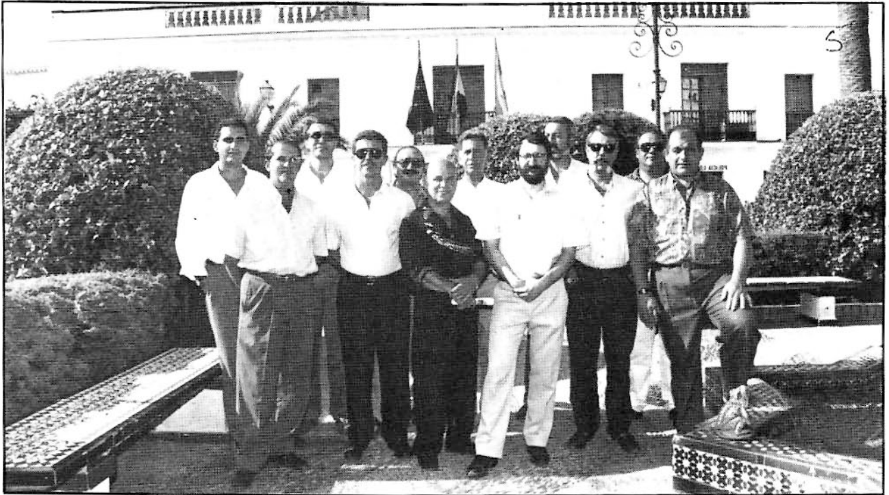
Miembros de la Comisión Municipal del VII Centenario.

los aplausos y vivas a Tarifa del numeroso público que abarrotaba la plazuela. Finalizando el acto oficial con la interpretación del pasadoble "Tarifa Blanca" a cargo de la banda municipal de música.