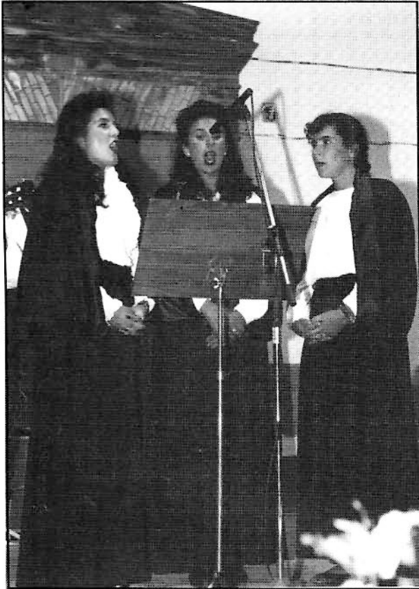
Momento de la actuación del Grupo de Cámara de la Coral de Tarifa.