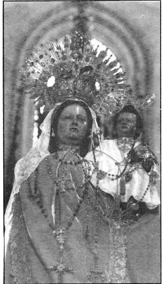
Imagen de la Virgen de la Luz.

En cuyos términos y bajo las predichas circunstancias hago esta donación y desestimiento, para que con arreglo a ellas use de las repetidas prendas la mencionada hermandad y en sus respectivos casos tengan el destino que las doy para si se verifica, pero si esto no llegase, subsistirán en la forma que también dejo designada sin que por el dominio que concedo a dicha Imagen puedan oponerse a cosa alguna de la que llevo dispuestas, como ni tampoco podrán hacerlo mis herederos sucesores, ni otra persona que con cualquier representación quiera intentarlo; porque por el hecho de emprenderlo se ha de entender confirmada y ratificada esta escritura en todas sus partes y perfecta la donación que incluye, a fin de que siempre tenga entera validación y fuerza para lo cual declaro que ni es inmensa ni necesito de las explicadas alhajas, porque me quedan bienes más que suficientes par mi decente