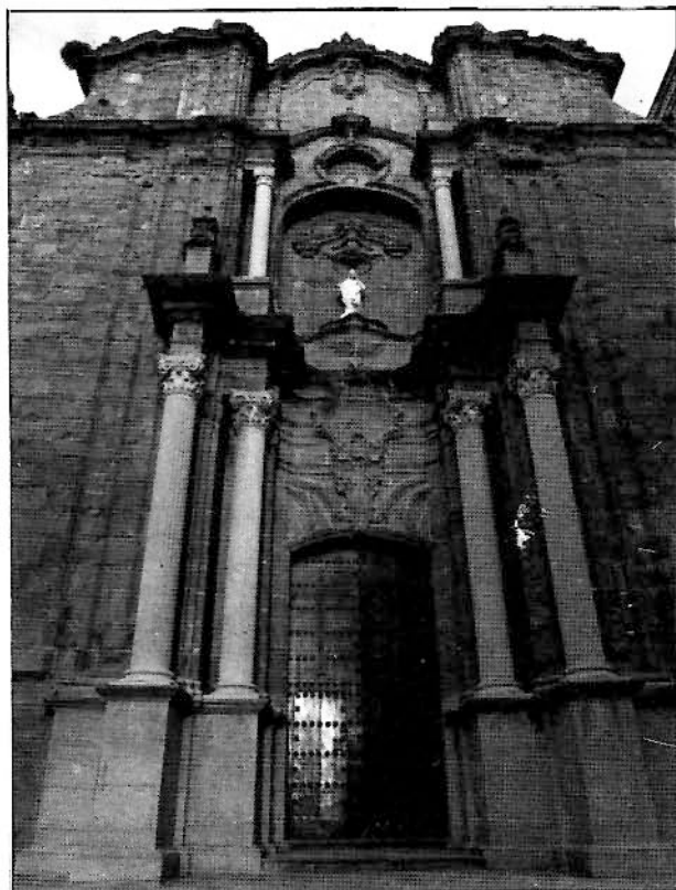
Fachada de la Iglesia de San Mateo (Foto M. Rojas).

todos los tarifeños conozcan un poco más de la historia de su ciudad.