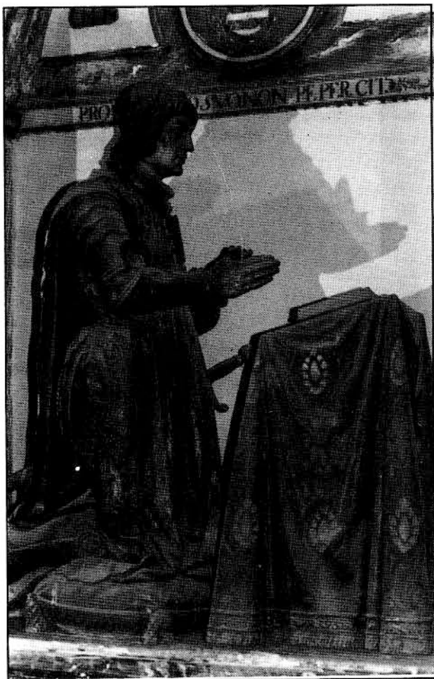
Imagen orante de Guzmán el Bueno, obra de Martínez Montañés.

treguas con Castilla. Estas son rotas por este reino al iniciar el 27 de julio de 1.309 el cerco de Algeciras. Entre los muchos caballeros que acompañan a Fernando IV nos encontramos a Don Alonso.