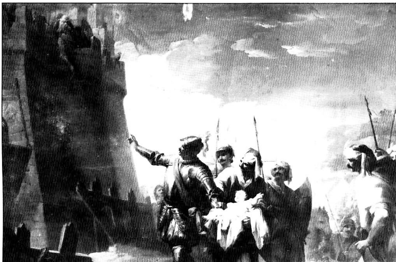
Guzmán el Bueno en Tarifa, cuadro de Mariano Salvador de Maella.