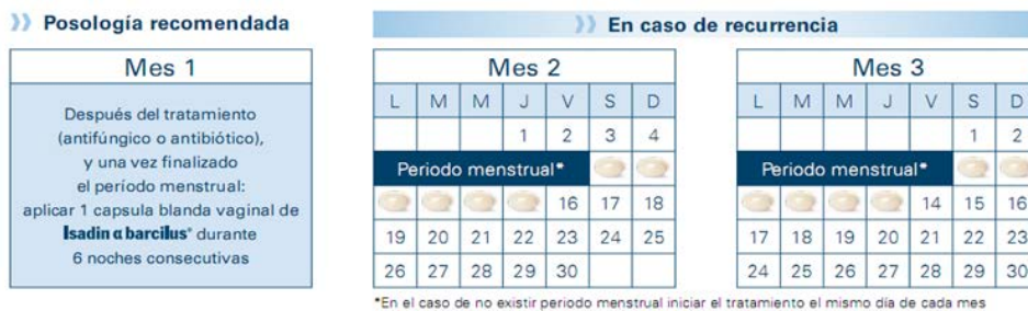
Figura 2 Calendario profiláctico de Isadin-a-barculus por vía vaginal.