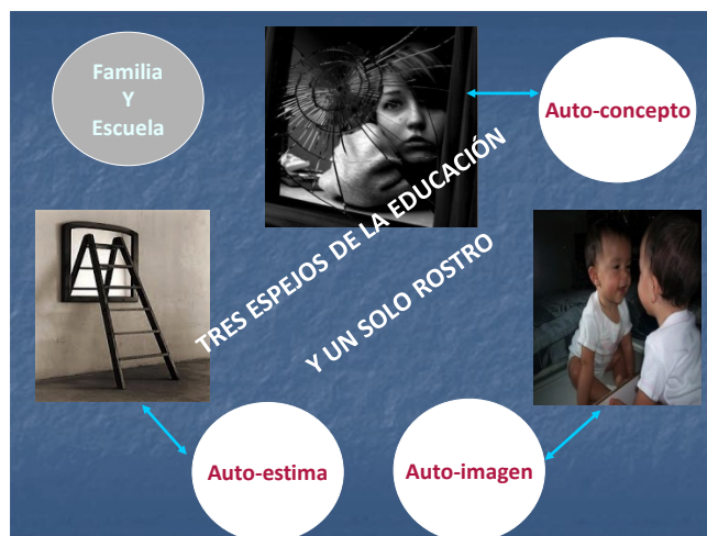
Figura 3. Tres espejos de la educación y un solo rostro

Comenzaremos la tarea abordando lo que para nosotros constituye los tres pilares básicos iniciales: el autoconocimiento, la autoestima y el autoconcepto. Este último pilar es el que abordaremos, específicamente, en el taller que vamos a desarrollar a continuación.