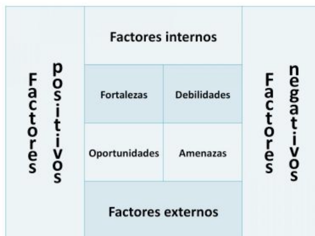
Figura 4. Elementos de un análisis DAFO de la familia

Mediante el análisis DAFO (Debilidades, Amenaza, Fortalezas y Oportunidades) podemos lograr un conocimiento más profundo de la familia, sus miembros, conductas, relaciones, etc.