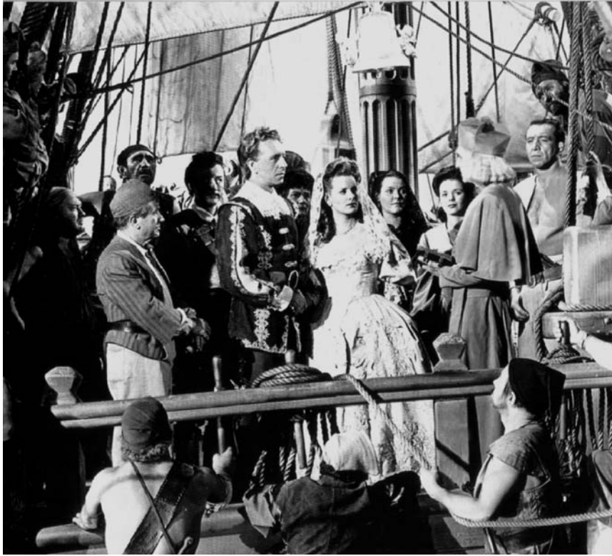
Figura 1. Fotograma de la película Caribe

siglo XVIII, el filme narra la historia de Laurent Van Horn, patrón de un barco holandés que embarranca en las costas de Cartagena, cuyo virrey es Juan Alvarado de Soto. Este hace prisionera a la tripulación holandesa, que sin embargo logra huir y adueñarse de un barco. Van Horn se convierte entonces en el famoso pirata Barrancuda, deseoso de vengarse del imperio español. Su plan será raptar a la prometida del virrey, Francisca de Guzmán y Argandora, quien terminará por enamorarse del capitán holandés. Se trata de una película de batallas navales, duelos de espadas y amor romántico, donde los españoles aparecen como aristócratas holgazanes y conservadores en contraposición al carácter moderno, práctico y civilizado de los holandeses. El Caribe es de nuevo representado como un lugar abandonado a su suerte, como un territorio gobernado por las pasiones e impulsos de un conjunto de individuos de turbio pasado que han terminado por recalar en las aguas tropicales. Aquí no hay la más mínima referencia al contexto cultural o demográfico del archipiélago, si bien se utiliza de nuevo el recurso a una naturaleza salvaje y desmesurada como símbolo de la psicología interior de los personajes que en ella habitan. Estas son unas ca-