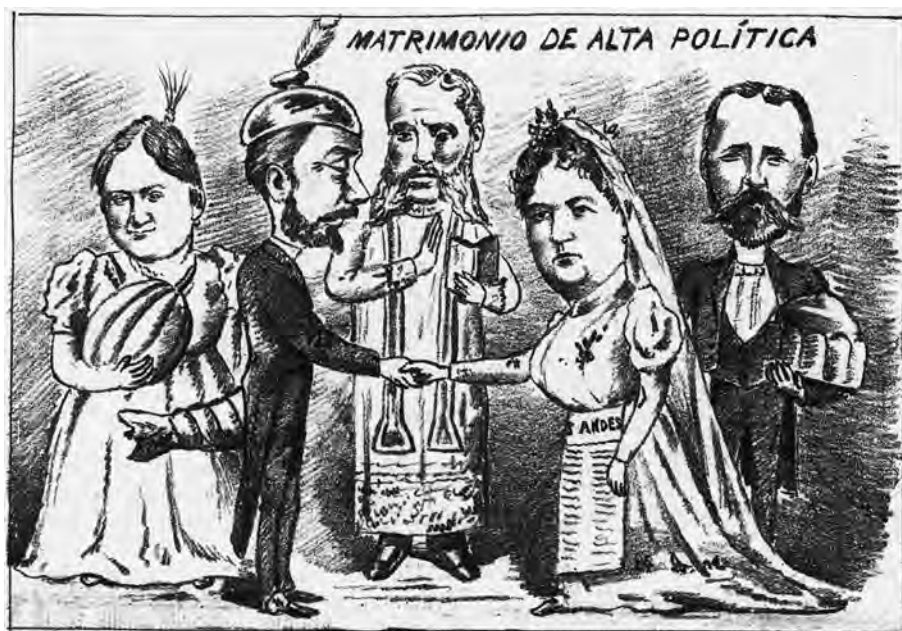
FIG. 3. Matrimonio de alta política. 1892, caricatura.