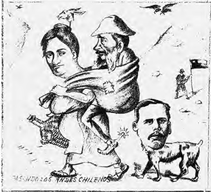
FIG. 5. Pasando los Andes chilenos. 18 de mayo de 1895, caricatura.