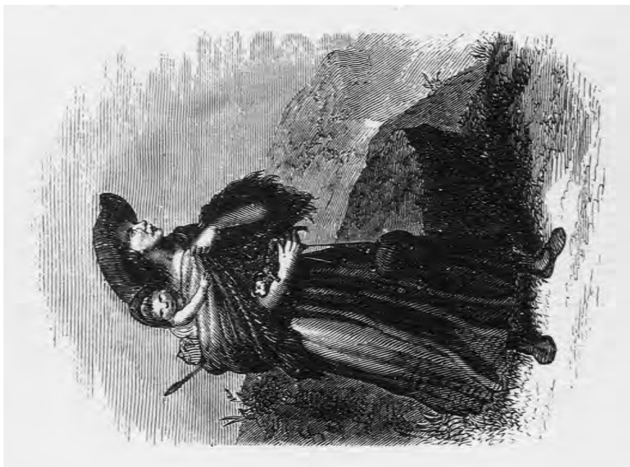
FIG. 8. Rabona en marcha. 1890, xilografía.