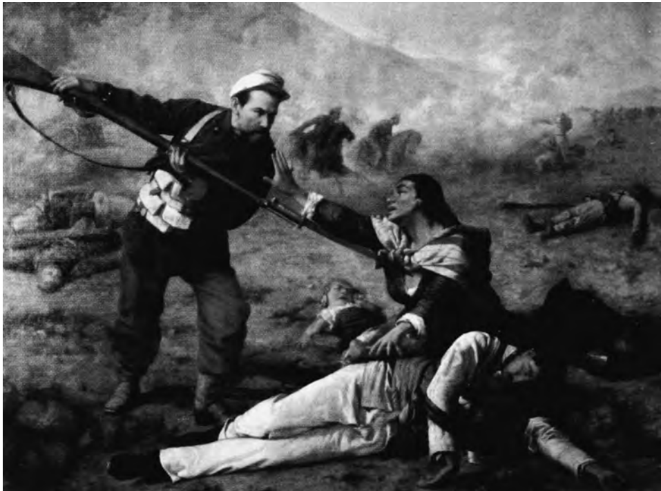
FIG. 1. Ramón Muñiz. El repase. 1888, óleo sobre tela. Museo del Real Felipe.