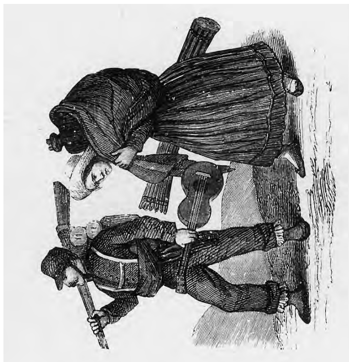
FIG. 7. Soldado de infantería en marcha fuera de la ley. 1890, xilografía.