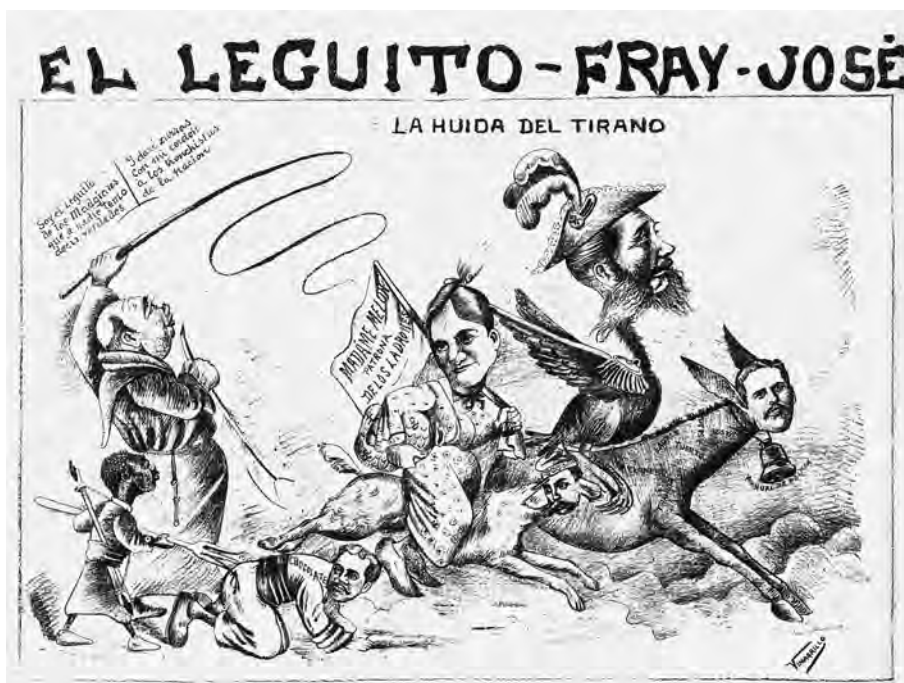
FIG. 4. La huida del tirano. 17 de abril de 1895, caricatura.