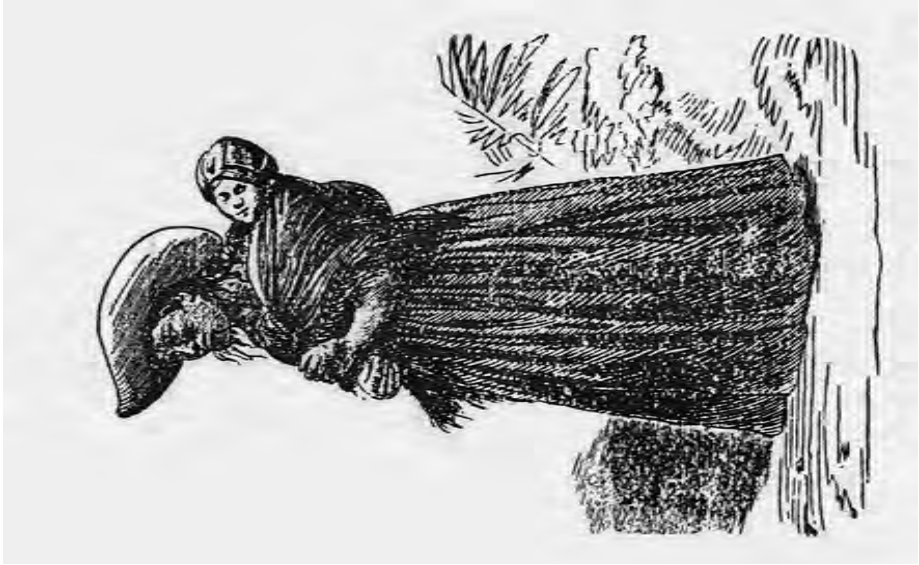
FIG. 9. Rabona en marcha. 1890, xilografía.