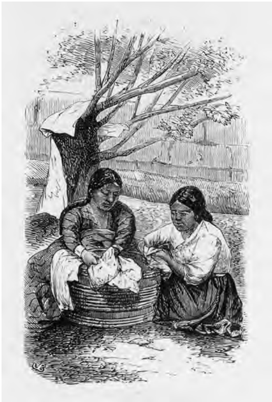
FIG. 6. Rabonas lavando. 1890, xilografía.