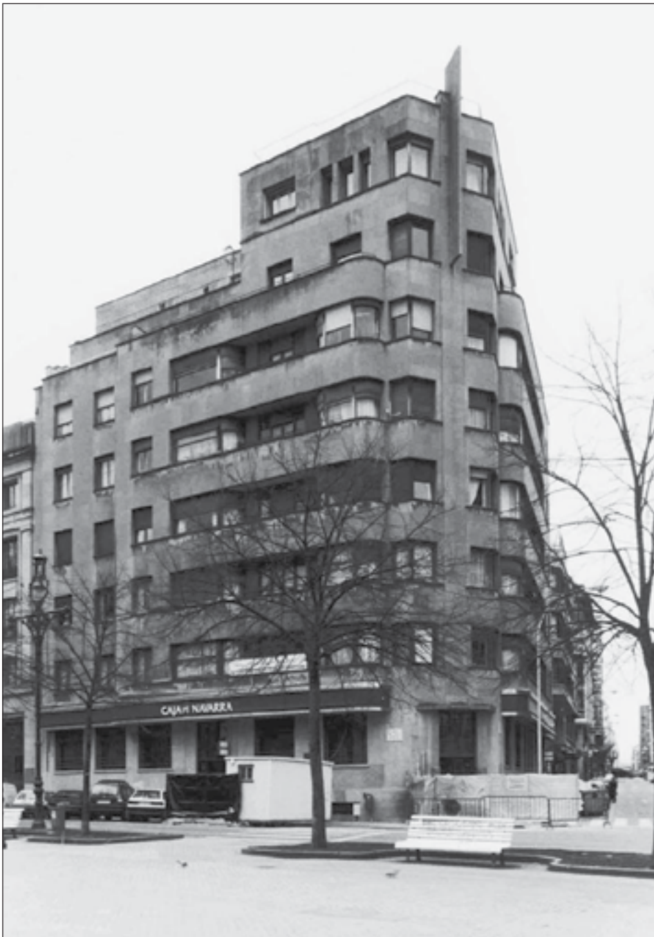
Figura 4: Edificio de viviendas en el paseo de Sarasate, 5, Pamplona. Joaquín Zarranz. 1936.