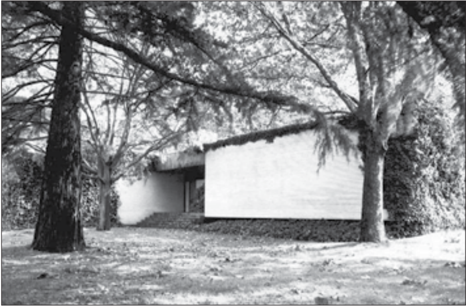
Figura 9: Casa Felipe Huarte. Carretera de Sarriguren, 5, Pamplona. Fernando Redón. 1959.