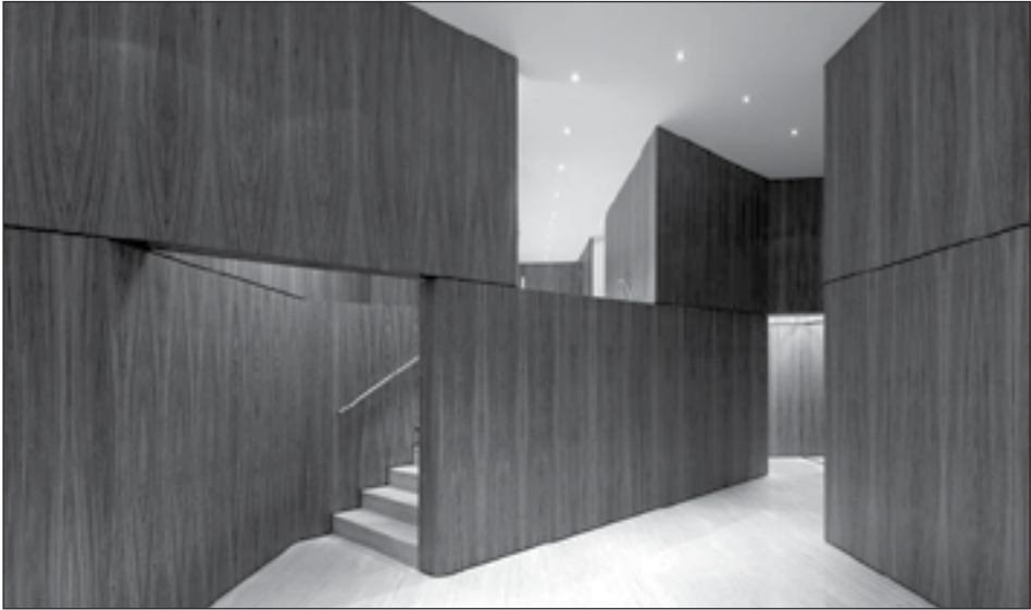
Figura 19: Reforma de portal en Pío XII, 29, Pamplona. Íñigo Beguiristáin, Iñaki Bergera. 2010.