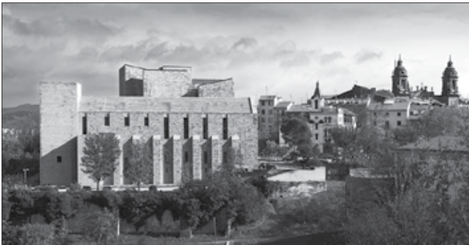
Figura 12: Archivo General de Navarra. Dos de Mayo, s/n, Pamplona. Rafael Moneo. 2003.