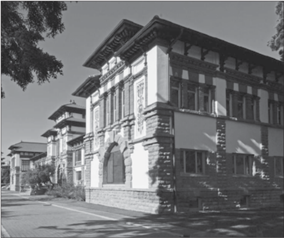
Figura 3: Antigua Escuela de Peritos Agrícolas. Serapio Huici, 22, Villava. José Yárnoz. 1912.