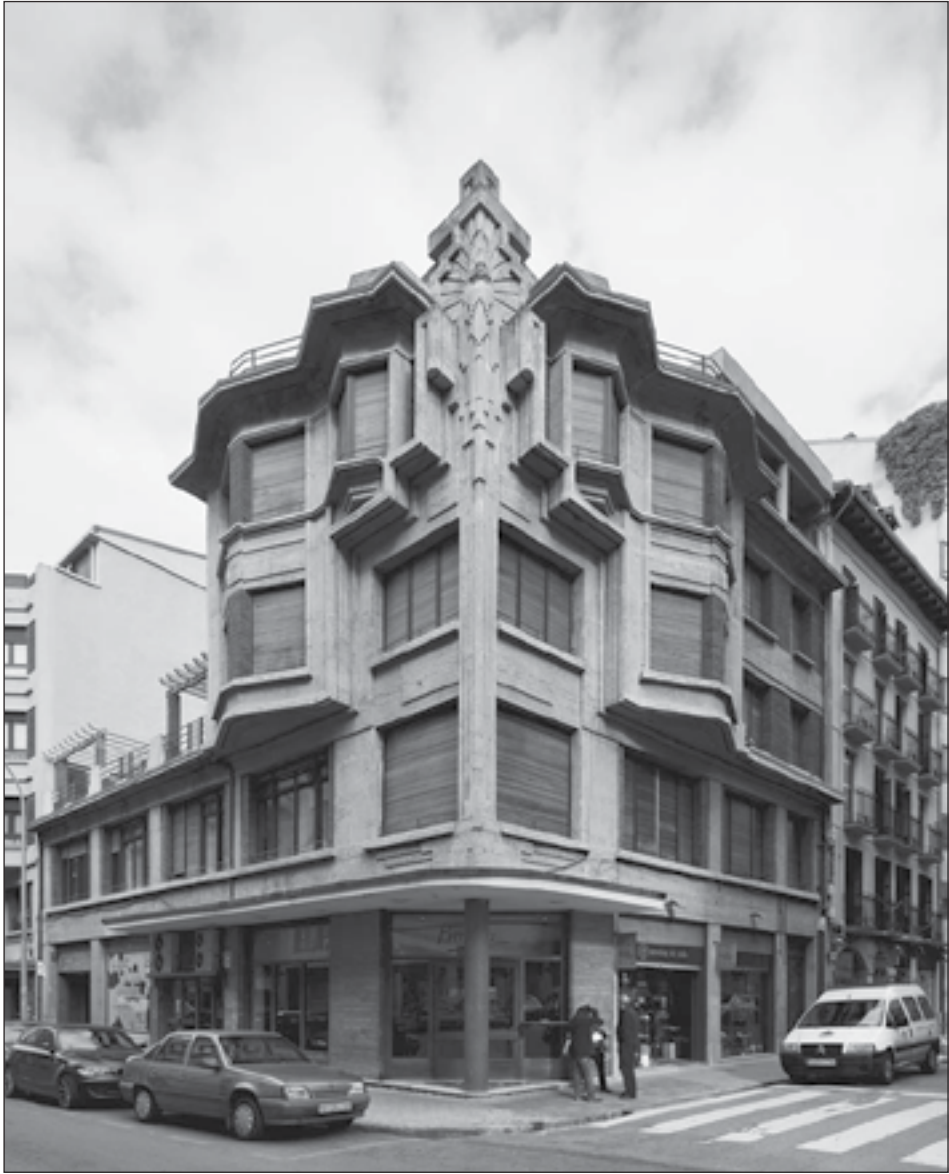
Figura 5: Edificio de viviendas Irigoyen y Café Bahía. Trinidad Fernández Arenas, 4, Pamplona. Víctor Eusa. 1932.