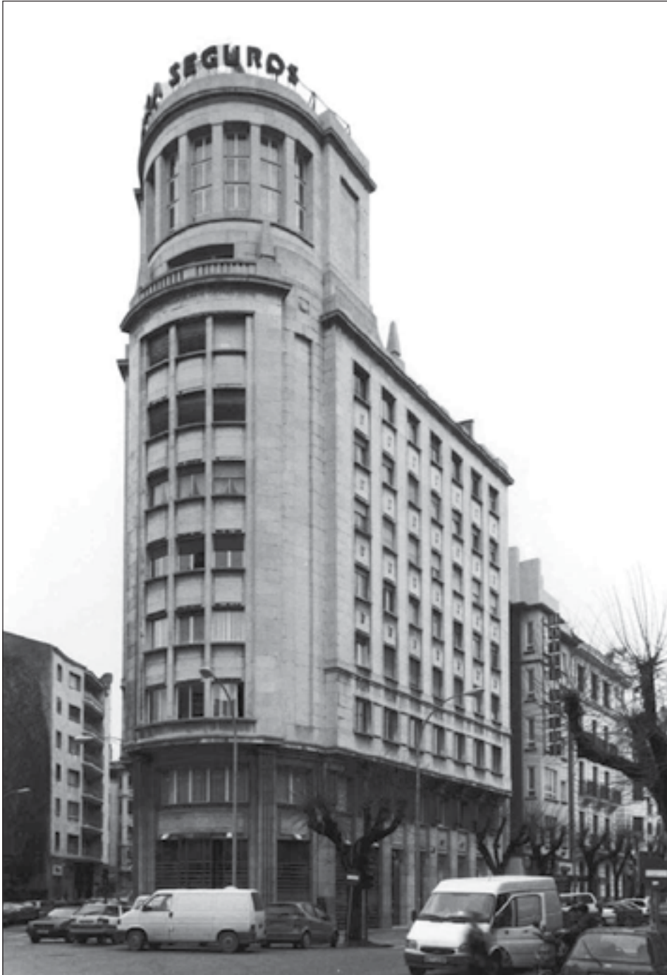
Figura 8: Edificio Aurora. Francisco Bergamín, 1, Pamplona. Víctor Eusa. 1950.