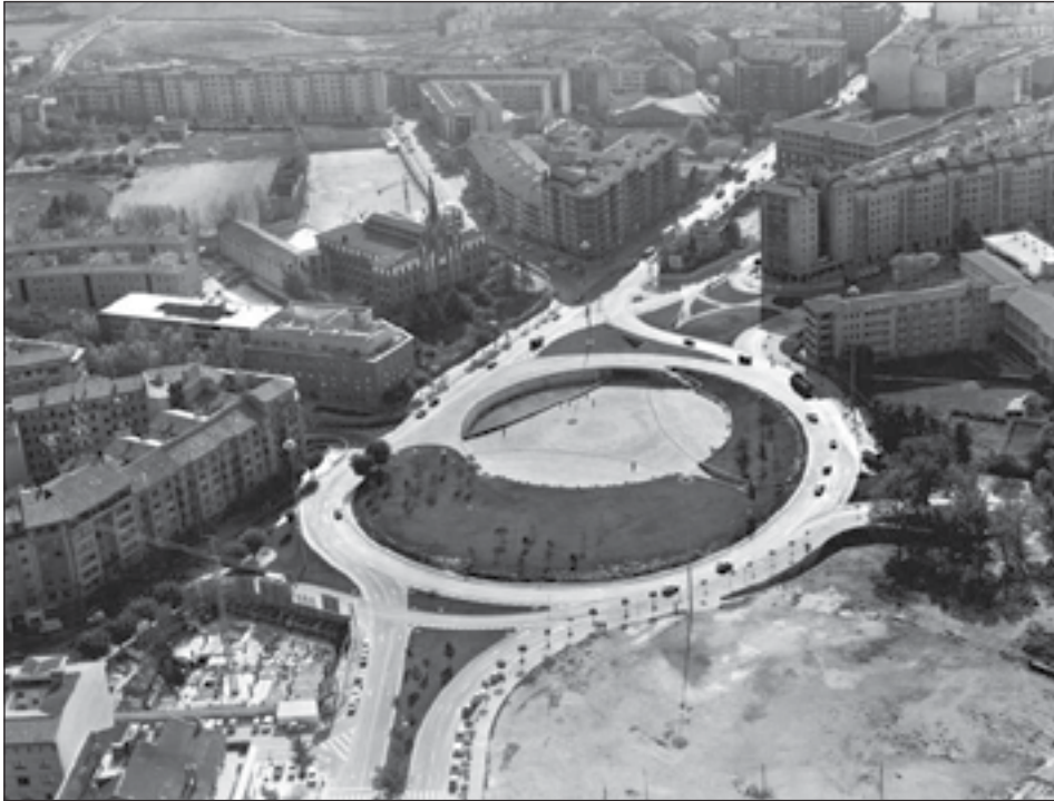
Figura 11: Plaza de los Fueros, Pamplona. Estanislao de la Quadra-Salcedo, Rafael Moneo. 1975.