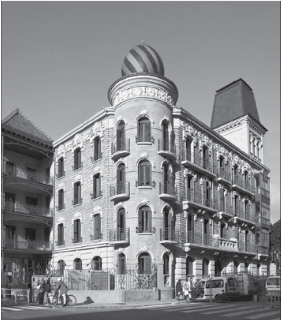
Figura 1: General Chinchilla, 6, Pamplona. Manuel Martínez Ubago. 1900.

1. Navarra Fin de Siglo. Entre el modernismo y el eclecticismo