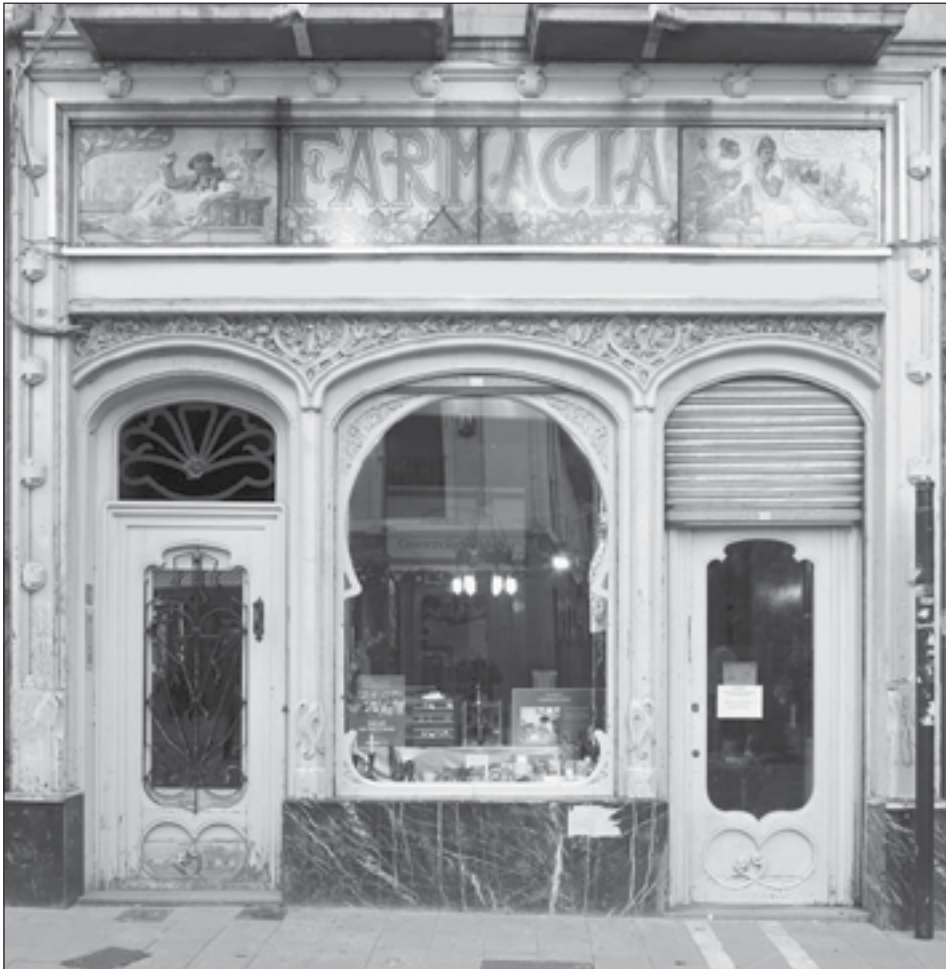
Figura 2: Farmacia Blasco. Mercaderes 21, Pamplona. Ángel Goicoechea. 1905.