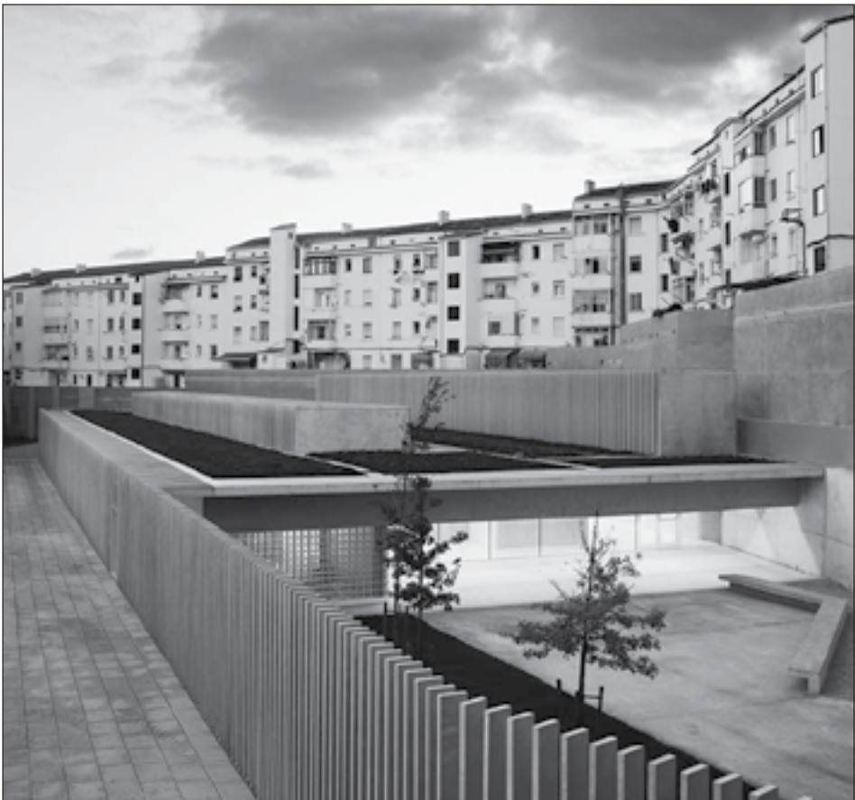
Figura 20: Escuela Infantil en La Milagrosa. Plaza de Alfredo Floristán, Pamplona. Carlos Pereda, Oscar Pérez. 2011.