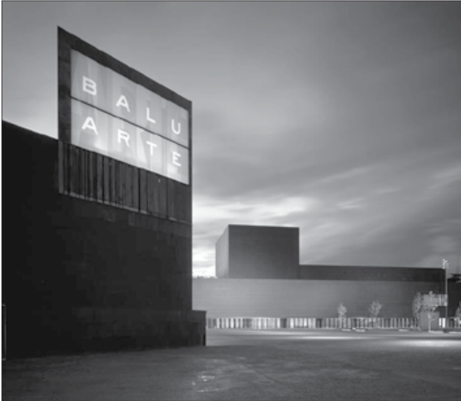
Figura 18: Palacio de Congresos y Auditorio de Navarra. Alfonso Alzugaray, Francisco Mangado. 2002.