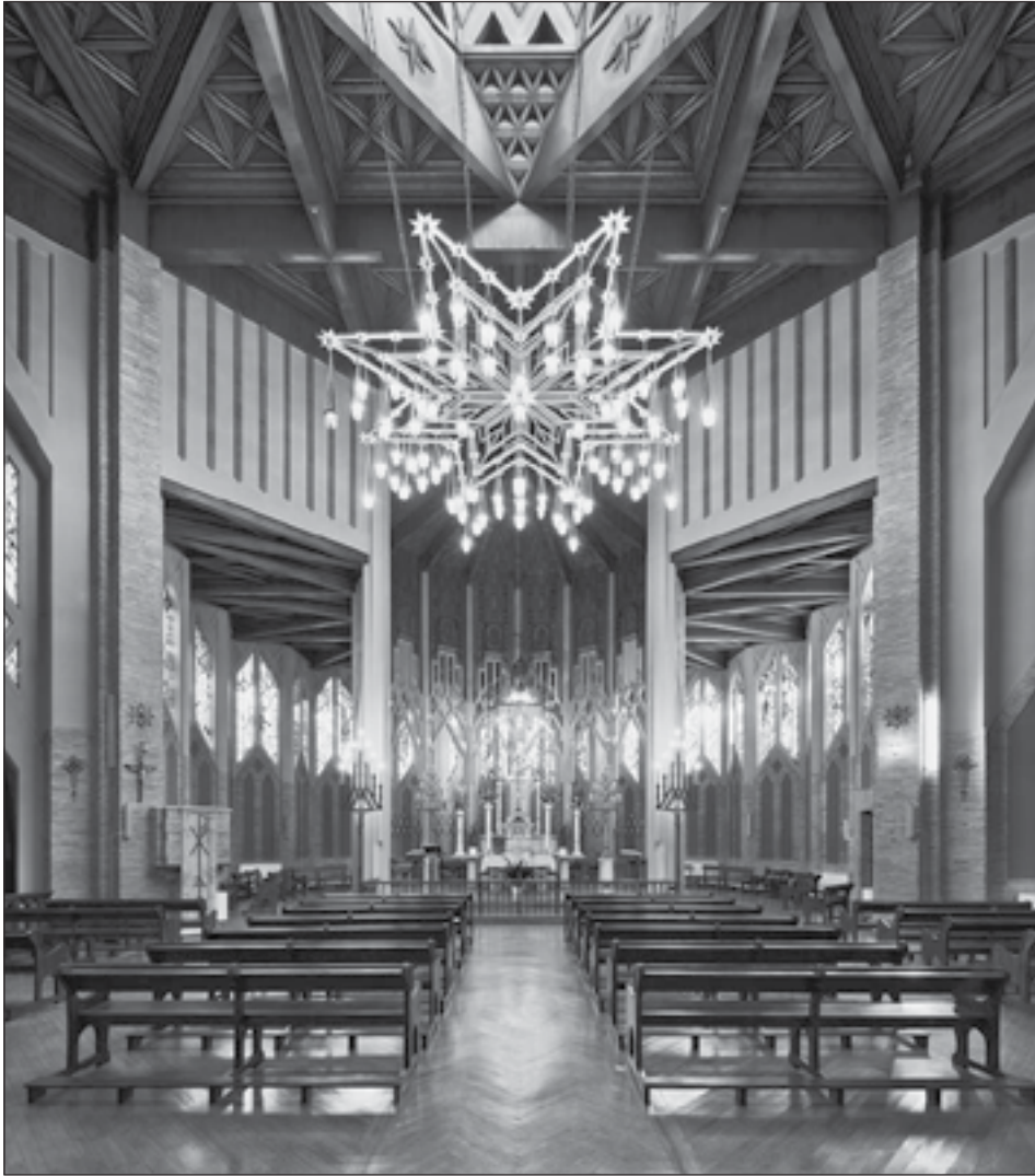
Figura 6: Basílica de Nuestra Señora del Puy, Estella. Víctor Eusa. 1951.