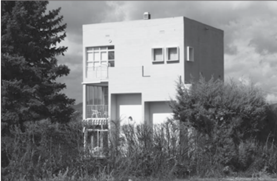
Figura 15: Vivienda unifamiliar en Tajonar. Francisco J. Biurrun. 1976.