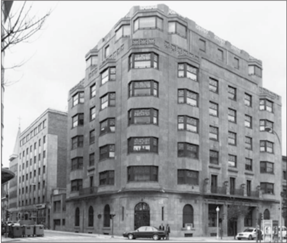
Figura 7: Hacienda Foral de Navarra. Avenida Carlos III, 4, Pamplona. José Yárnoz. 1931.