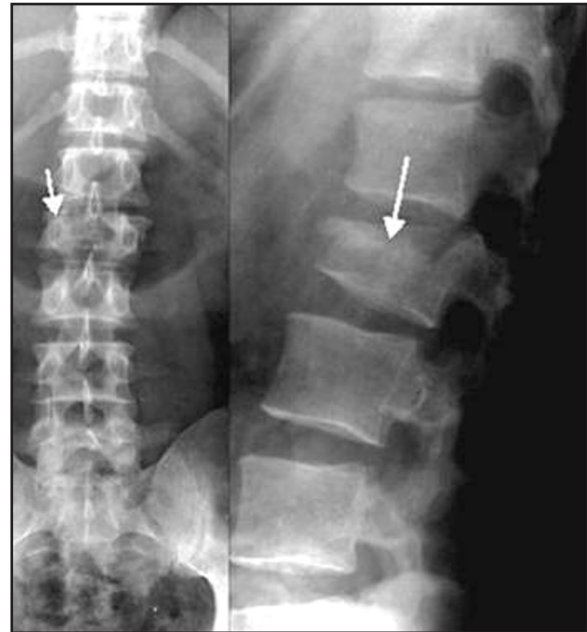
Figura 1. Radiografías lateral y anteroposterior de columna lumbar de la paciente. Las flechas señalan la fractura vertebral (L2)

momento ha sido un éxito y ha cumplido exactamente lo que esperábamos de él. Por otro lado, la paciente está asintomática, los marcadores bioquímicos de remodelado óseo son normales, y su densidad mineral ósea no ha dejado de aumentar desde que se inició la terapia.