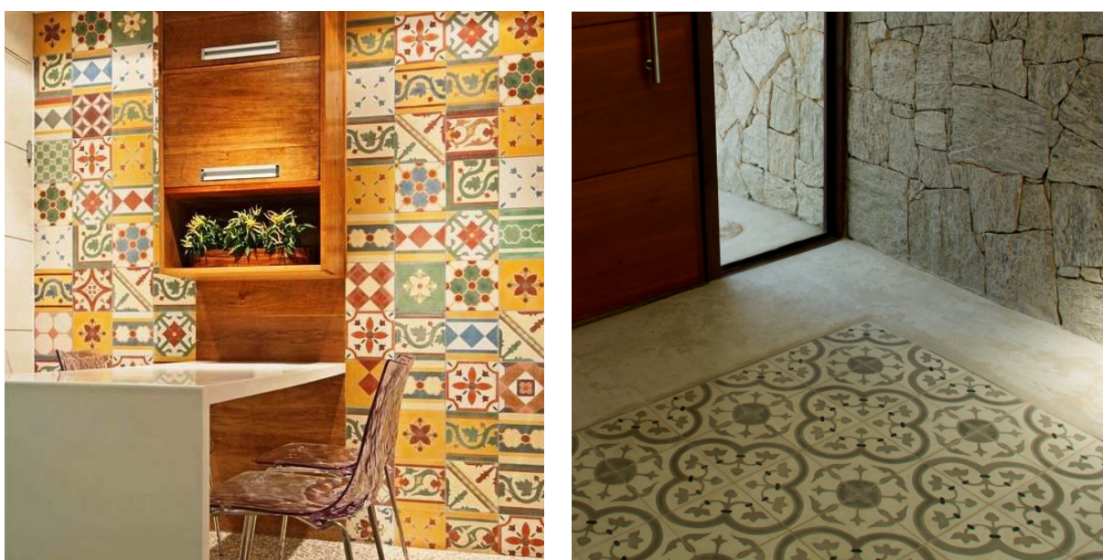
Figura 6 – Exemplos de uso de porcelanatos com texturas de ladrilhos hidráulicos combinados a outros materiais