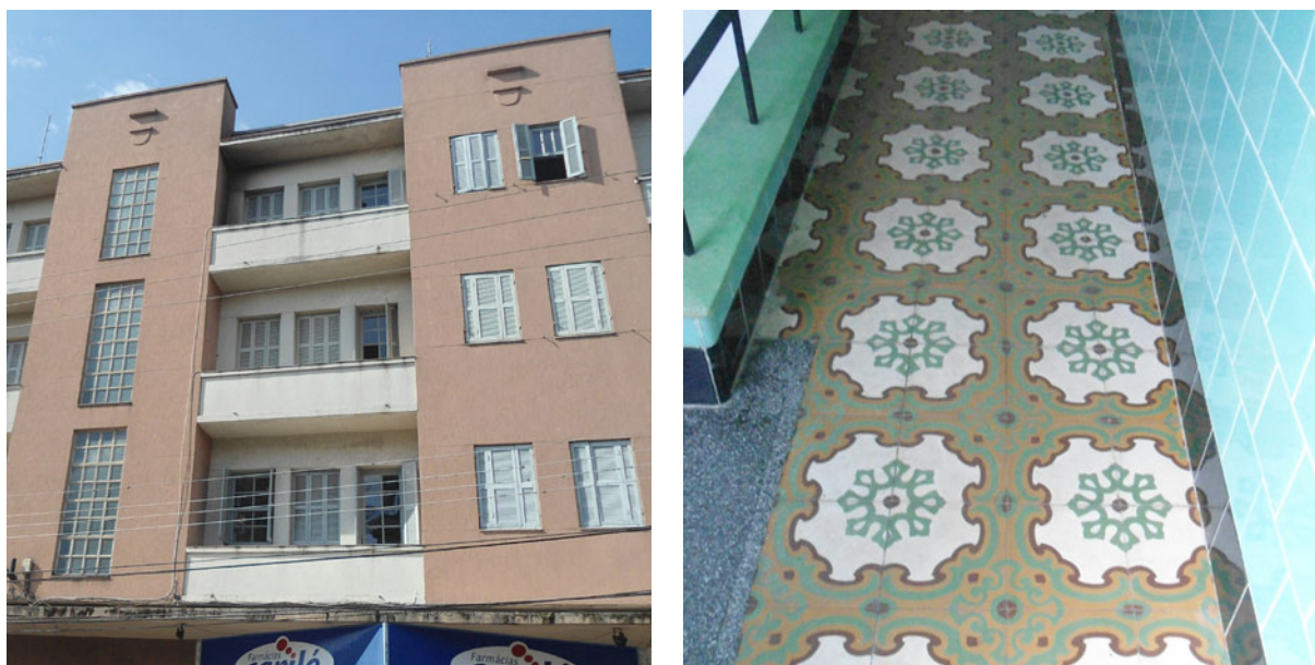
Figura 4 – Antigo posto de serviços Esso, com seus revestimentos de piso em ladrilhos hidráulicos bem conservados

Conforme Ruviano (2012), o art déco foi a princípio um estilo caracterizado pelo alto luxo e ornamentação formal, mas que em virtude da Grande Depressão 7 passou a valorizar também materiais e formas que poderiam ser produzidos em série, de modo fácil e econômico. Já Pevsner (1995) e Tambini (1999) asseguram que o art déco possui na arquitetura, nas artes plásticas, no design gráfico e industrial, nos objetos, no mobiliário, nos tecidos, na arquitetura de interiores, no vidro, na moda e no vestuário, ligados à vida cotidiana, suas manifestações mais significativas. Entre estas, encontra-se o ladrilho hidráulico, extremamente usado e bem-aceito na época e que atualmente volta a ser aplicado nos projetos de arquitetura.