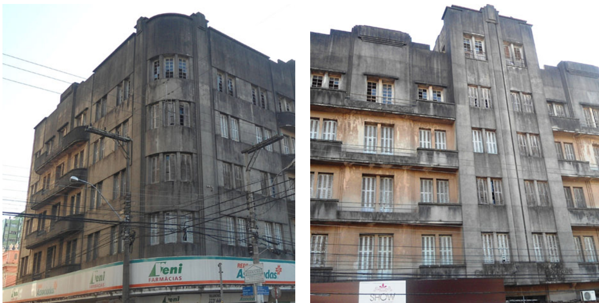
Figura 1 – Arquitetura art déco – antigo Hotel Jantzen, construído em 1940. Foi o primeiro prédio de quatro andares erigido em Santa Maria