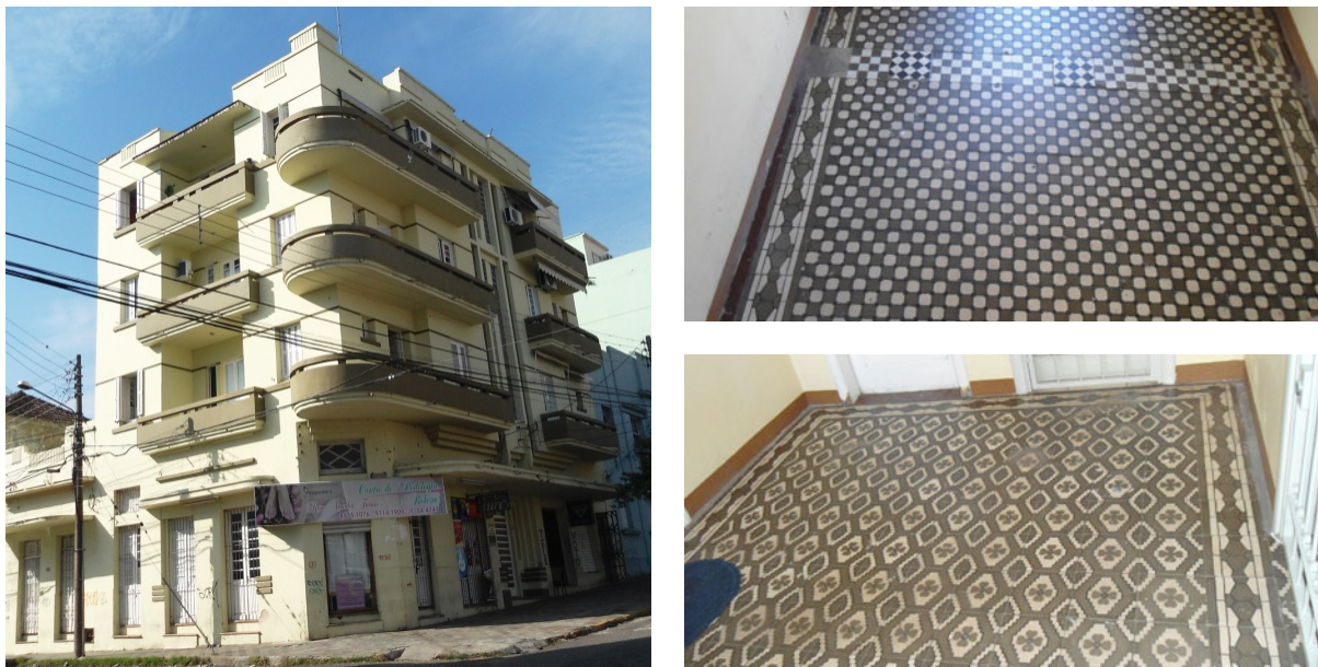
Figura 8 – Edifício Ibirapuitan e os ladrilhos hidráulicos nos corredores do prédio