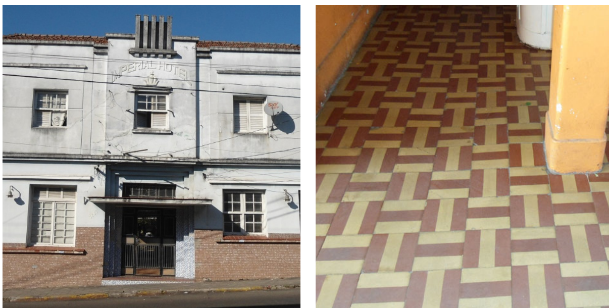
Figura 7 – Hotel Imperial é retrato do descaso com o revestimento em seu interior

Os ladrilhos hidráulicos são manifestações artísticas perdidas ou negligenciadas, em virtude da desconsideração e da falta de manutenção por parte de seus moradores para com as peças que ainda se conservam nos interiores das edificações em estilo art déco , os quais foram amplamente utilizados no período retratado.