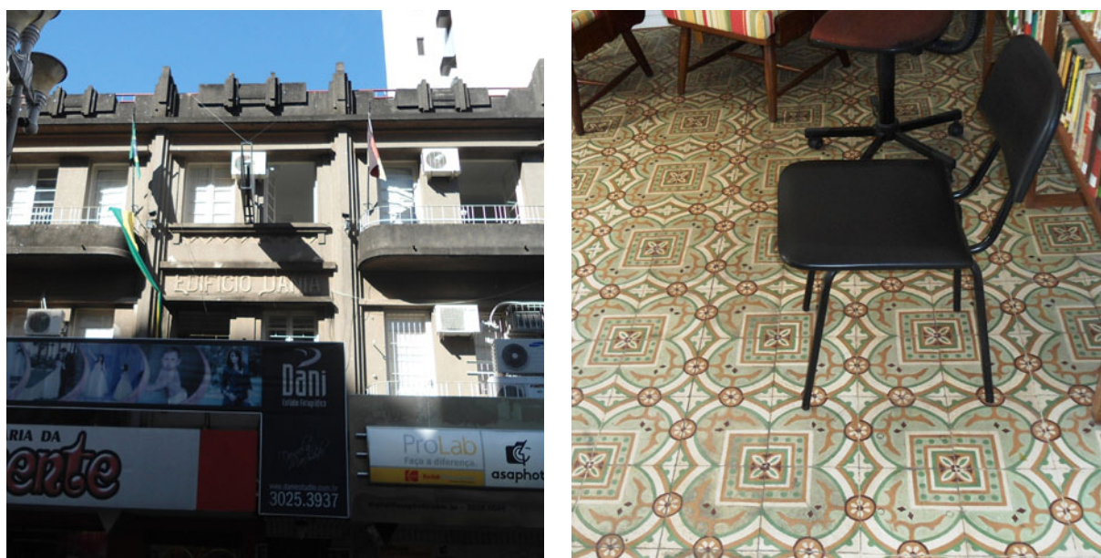
Figura 3 – Edifício Dania, localizado no Calçadão Salvador Isaias, e os ladrilhos hidráulicos ainda conservados no seu interior

Além do centro histórico da cidade, o estilo art déco também é visto nos bairros e nas residências mais modestos de Santa Maria, onde ainda hoje se percebem frisos retos, sacadas arredondadas, janelas com venezianas em madeira, uso de sirex 3 nas fachadas, atual fulget 4 , e do ladrilho hidráulico no interior de algumas residências e corredores de prédios. Essas são características marcantes da época, e de maneira geral muitas edificações permanecem na paisagem de Santa Maria do mesmo modo como quando foram construídas (FOLETTTO, 2008).