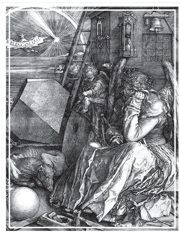
Figura 1 – Albrecht Dürer, Melancolia I , gravura (31 x 26 cm), 1514. Alemanha

Erwin Panofsky sublinha a melancolia imaginativa como faceta principal da gravura Melancolia I , de Albrecht Dürer – o que permite lê-la como produto do imaginário alquímico do período. O anjo sentado, de fisionomia aborrecida e contrariada, manuseando com displicência a ponta do compasso que tem nas mãos e com o qual poderia “redesenhar” o espaço que o rodeia, é a própria imagem da confusão de alma que é preciso sublimar, encontrando um caminho (PANOFSKY, 1964). A desarrumação dos objetos à volta de um anjo, que mais poderia ser uma “dona de casa”, incapaz de pôr ordem em suas coisas, é outro dos sinais que o artista fornece. A confusão do exterior torna-se reflexo da íntima confusão, enquanto se aguarda algum sinal ou que alguma coisa de repente mude, ainda que por acaso, mais do que por intervenção própria (PANOFSKY, 1964). A figura feminina também está atrelada à representação da peste – o flagelo cuja epidemia devastara diversas regiões da Alemanha.