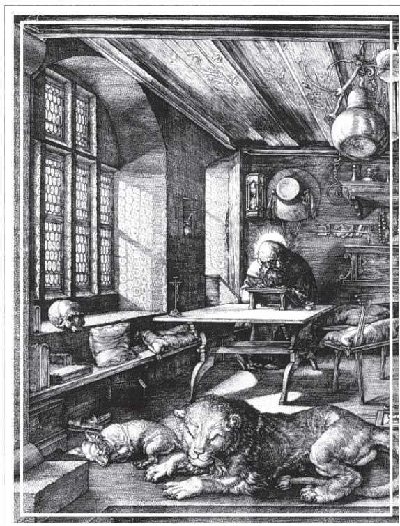
Figura 2 – Albrecht Dürer, São Jerônimo em seu estudo , gravura (31 x 26 cm), 1514. Alemanha