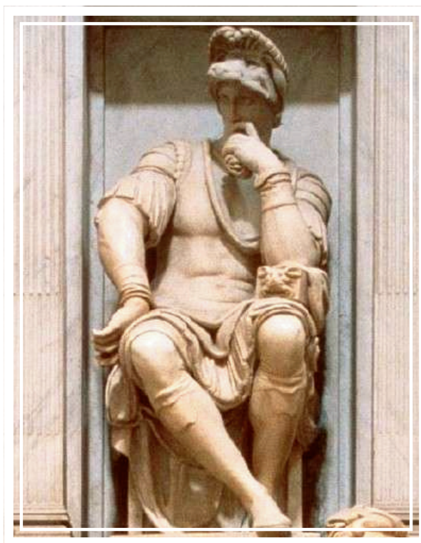
Figura 4 – Michelangelo, O Pensador , 1525, Basílica de San Lorenzo. Florença (Itália)