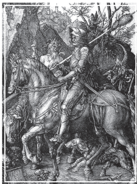
Figura 3 – Albrecht Dürer, O cavaleiro, a morte e o diabo , gravura (31 x 26 cm), 1513, Museum Boijmans van Beuningen. Holanda