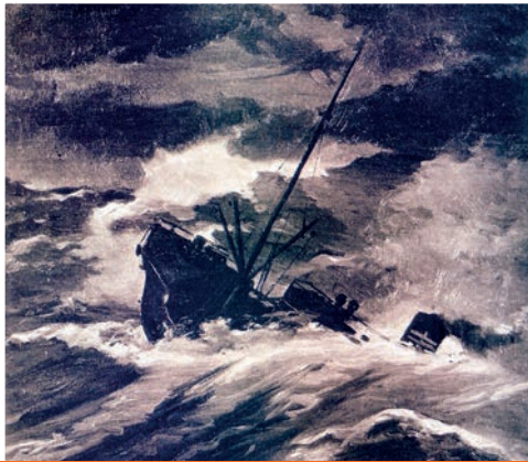
Recreación del hundimiento del Valbanera.