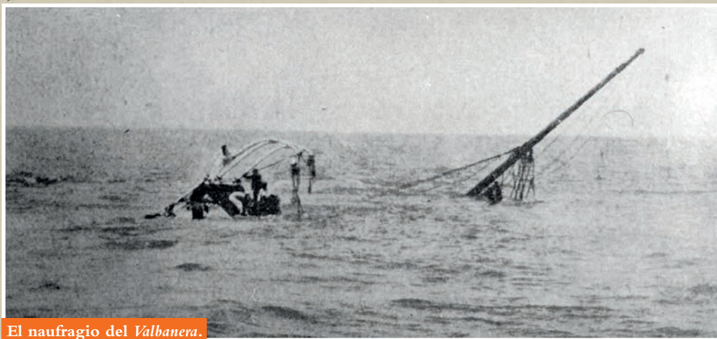
El naufragio del Valbanera .

marote de lujo y las 75 de los viajeros en clase emigrante. Semejante variación en el importe tenía su correlato en las condiciones de una y otra clase: de la ostentación de los primeros a la falta de privacidad e higiene de los segundos. Los emigrantes viajaban hacinados en los entrepuentes de las bodegas, en hileras interminables de literas metálicas de varios pisos y sin ninguna ventilación. Muchos preferían acampar en cubierta, a la intemperie, antes que sufrir las insalubres entrañas de la nave.