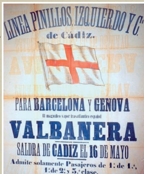
Cartel publicitario anunciando la salida del Valbanera .

O mejor, el Titanic riojano. El Valbanera (con “b”, fruto de un error ortográfico) no llevaba el nombre de nuestra virgen patrona por casualidad. Se trataba de uno de los buques insignias de la compañía naviera Martínez Pinillos y Cía , creada en 1840 por Miguel Martínez de Pinillos y Sáenz de Velasco, natural de Nieva de Cameros. Martínez de Pinillos se había asentado en Cádiz siguiendo la estela de su hermano, Sebastián, como tantos otros cameranos hicieron en ese siglo XIX plagado de emigrantes serranos. Muy pronto se vinculó al tráfico mercantil, organizando fletes entre España y Cuba. Un producto resultó particularmente lucrativo en este trasiego de mercancías: el azúcar. Con su comercialización capitalizó su empresa hasta el punto de poder convertirse en una de las navieras más dinámicas del momento.