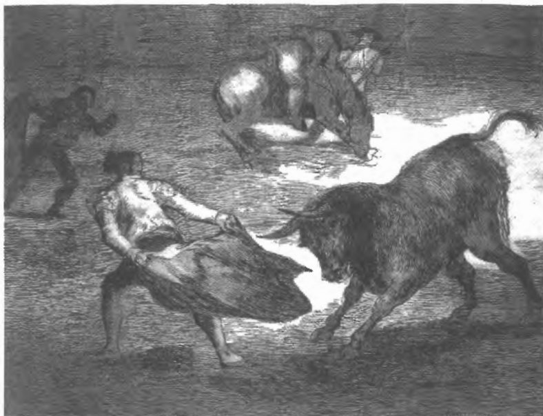
Fig. n.º 4.- De la Tauromaquia de Goya.

veces ambiguas, que encubren y desvelan la complejidad de la formación identitaria de los hombres en sus diversas tendencias sexuales y expresiones de género. Libres en cuanto tanto en Creta, Grecia y Roma ( male mas ), como en la