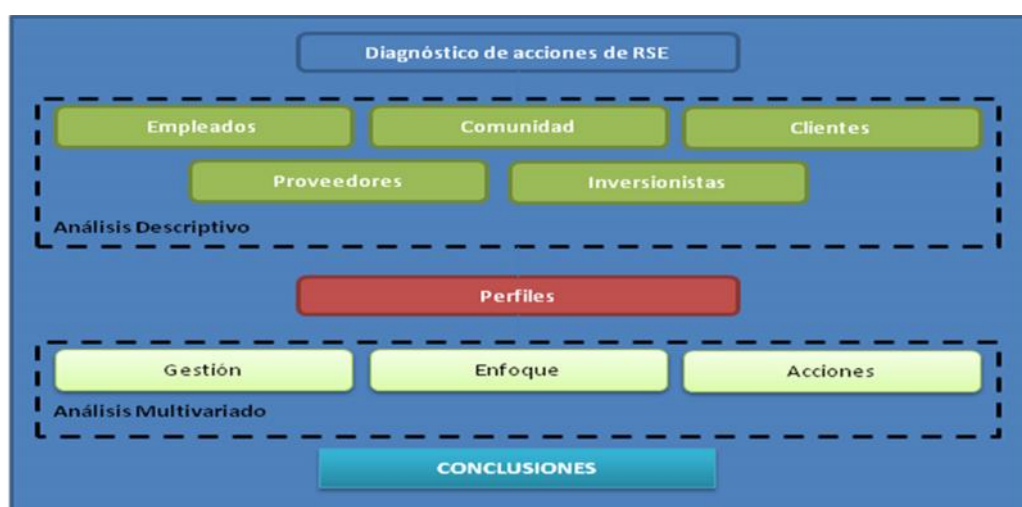
Figura 1: Proceso metodológico aplicado