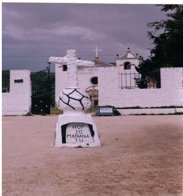
Imagen tomada del cementerio de Copacabana 2010