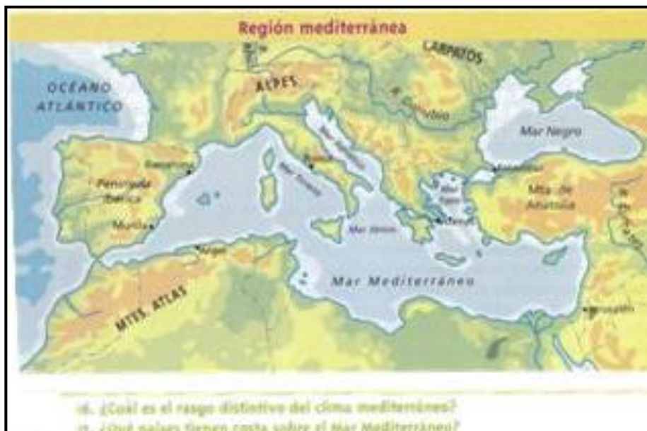
Fig. 5. Mapa Coroplético de la Región Mediterránea. El mismo no presenta coordenadas geográficas, norte y referencias.

A partir del mapa coroplético (Fig. 4) que acompaña un texto sobre la región mediterránea, se pretende explicar las características distintivas del clima de dicho espacio geográfico. El recurso está acompañado por dos preguntas disparadoras que aparecen guiando la lectura del mapa. La primera pregunta apunta al rasgo distintivo del clima mediterráneo y el mapa expresa información del relieve y no unidades climáticas; y la segunda pregunta requiere de información sobre la división política y sólo se indican los nombres de algunas ciudades.