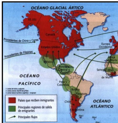
Fig. 4. Mapa temático de zonas receptoras y emisoras de población América. Obsérvese que las flechas indicadas con el numero 1 y 2 no es claro de que país provienen.

Además, aparecen países coloreados con rosa que no están categorizados en la referencia.