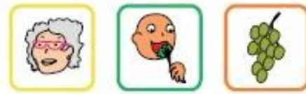
Figura 2: Pictogramas básicos

Tal como ilustra la Figura 2, un Sistema Pictográfico es una herramienta que permite la representación del lenguaje mediante dibujos, fotos e imágenes. El uso de pictogramas no es exclusivo de estos sistemas. Por ejemplo, a nuestro alrededor, encontramos numerosos ejemplos y tipos de pictogramas que nos ayudan a encontrar lugares, a organizar la circulación, tales como cartelera, anuncios, etc. Es decir, podemos comunicarnos utilizando objetos reales, fotos, dibujos o pictogramas.