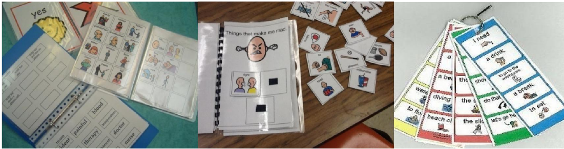
Figura 1: Ejemplos de Pictogramas

Haciendo un recorrido por las tecnologías disponibles en la actualidad (tablets, touchscreens, servicios WEB y smartphones, entre otros), es fácil imaginar que este inconveniente podría ser superado ampliamente, innovando en un nuevo sistema de comunicación siempre disponible y sin deterioros, tanto para el usuario con discapacidad como para el profesional y/o familiar que lo asiste.