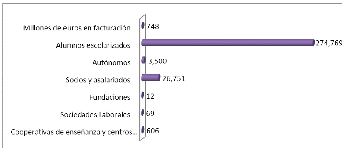
Gráfico 1. Situación cuantitativa de las Cooperativas Españolas de Enseñanza – 2012