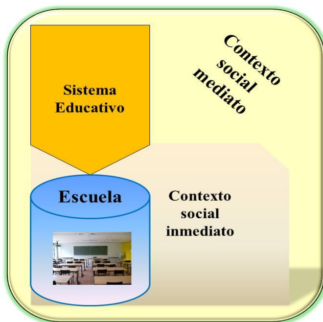
Figura 1. Contexto social y sistema educativo