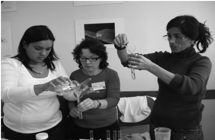
Figura 4. Propuestas experimentales durante el taller HaCE

La interacción activa de investigadores universitarios con educadores de las CTIM tiene efectos mucho más enriquecedores que simples cursos o talleres sobre lo que es el método científico. Es muy relevante lo que puede lograr un acercamiento entre los investigadores y los docentes. A veces los docentes explican el llamado “método científico” como formado por etapas que deben cumplirse, pero el trabajo experimental muchas veces va abriendo nuevos caminos y “torciendo” o aun invirtiendo algunas de esas etapas. Mucho más estimulante y aleccionador que el “discurso” sobre el método científico es llevarlo a la práctica realizando sencillas propuestas experimentales, como las que se muestran en el taller “HaCE” de la Figura 4 .