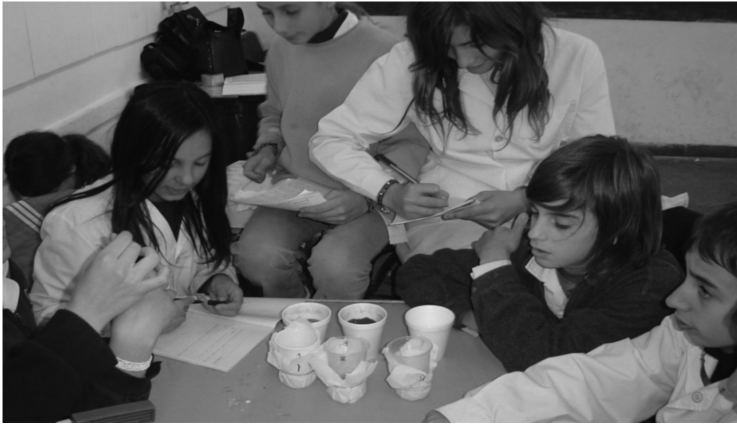
Figura 3. Trabajo con alumnos durante un taller de ciencia

resultado “anómalo” resulta más interesante y fructífero. Por lo tanto, el docente puede estar muy tranquilo de realizar experiencias con sus alumnos en el aula y frecuentemente puede suceder que no todos los alumnos tengan idénticos resultados, lo cual es la parte interesante de la metodología por indagación. En el aula no hay indisciplina. La Figura 3 muestra el interés y concentración de los alumnos durante el taller de ciencia (Módulo “Construyendo un Acuífero”).