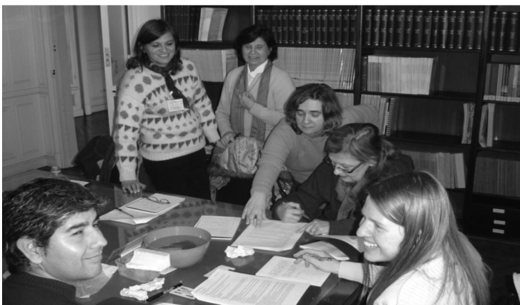
Figura 2. Taller HaCE para docentes realizado en la ANCEFN

expresiones tienen buena parte de verdad, y por eso pensamos que construir estos canales de comunicación es relevante para contribuir entre todos a mejorar la calidad de la educación en ciencia y tecnología. La Figura 2 muestra un Taller HaCE para docentes realizado en la ANCEFN (Módulo “Propiedades de la materia”).