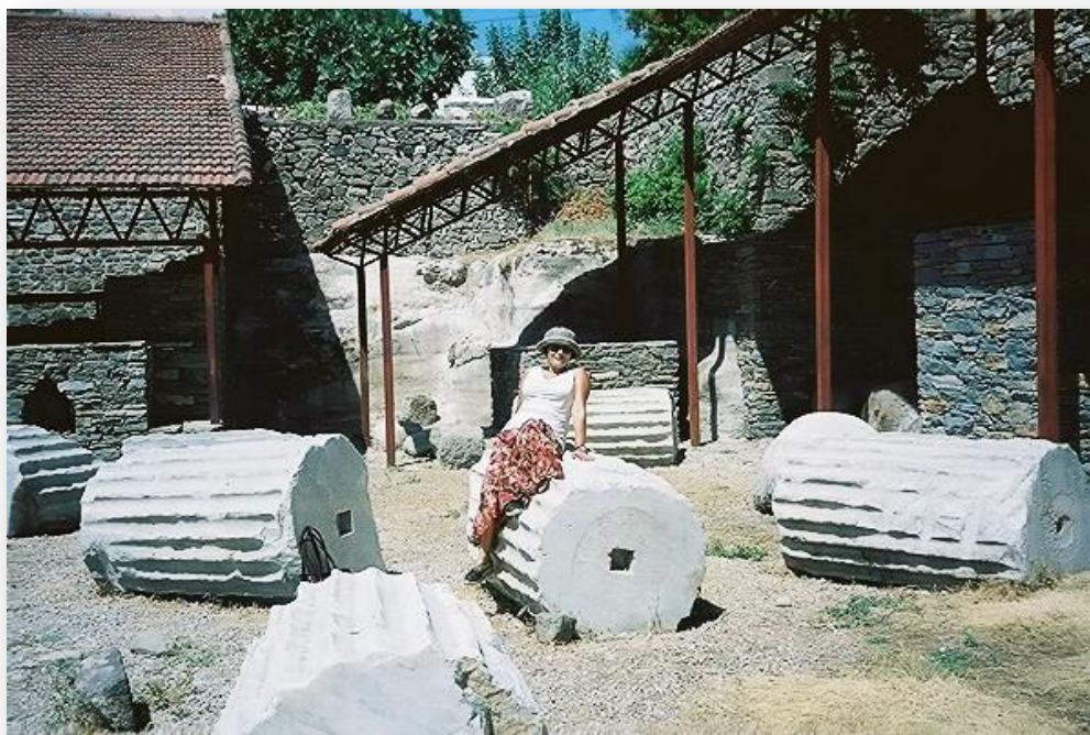
Más imágenes de las ruinas de lo que en su día fue una de las siete maravillas de la Antigüedad: el Mausoleo de Halicarnaso. Obsérvese el grosor de los tambores que formaban las columnas.