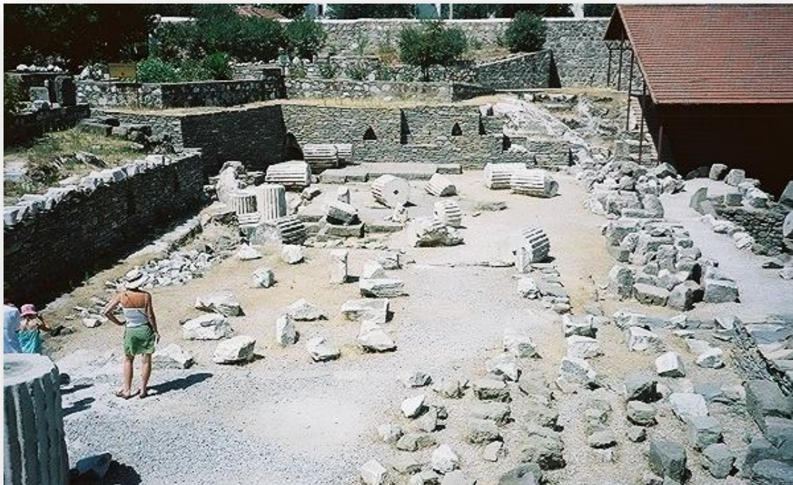
Bodrum, en el mismo lugar donde estaba situado el famoso Mausoleo.