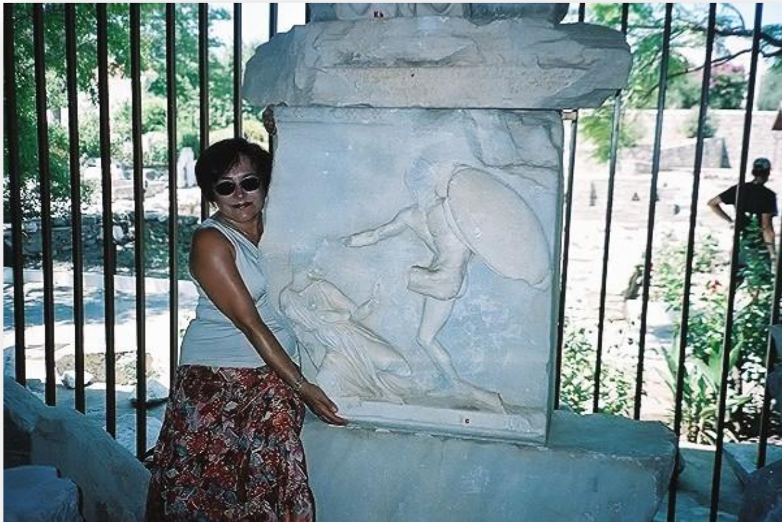
Un fragmento de un relieve perteneciente al Mausoleo de Halicarnaso, que se puede ver en la actual