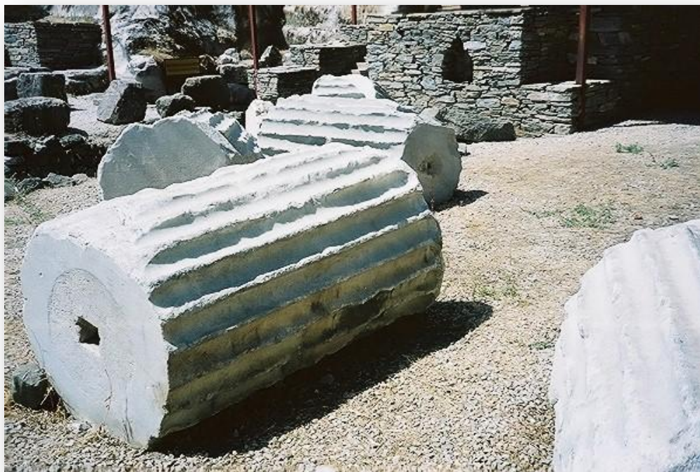
Bodrum: Ruinas del Mausoleo de Halicarnaso. Estado actual.