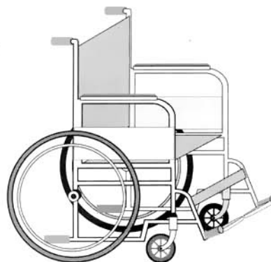
Grúa con ruedas y asiento de cabestrillo (izqda.) y silla de ruedas estándar (dcha.).

tas o normas deben ser remitidas al organismo nacional que pertenezca a ISO con la correspondiente explicación de la propuesta.