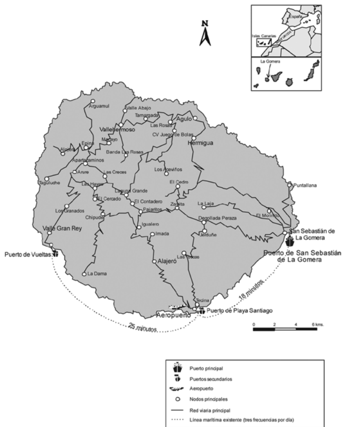
Figura 2 RED PRINCIPAL DE CARRETERAS Y NODOS PRINCIPALES DE LA ISLA DE LA GOMERA

La información existente sobre este particular es bastante limitada, aunque la que tenemos disponible se puede considerar fiable y, lo que es también muy importante, bastante reciente, en concreto del segundo semestre del año 2010. Dicha información, a partir de una encuesta del Parque Nacional, ha detectado, en cifras aproximativas, que el 7 % de los visitantes proce-