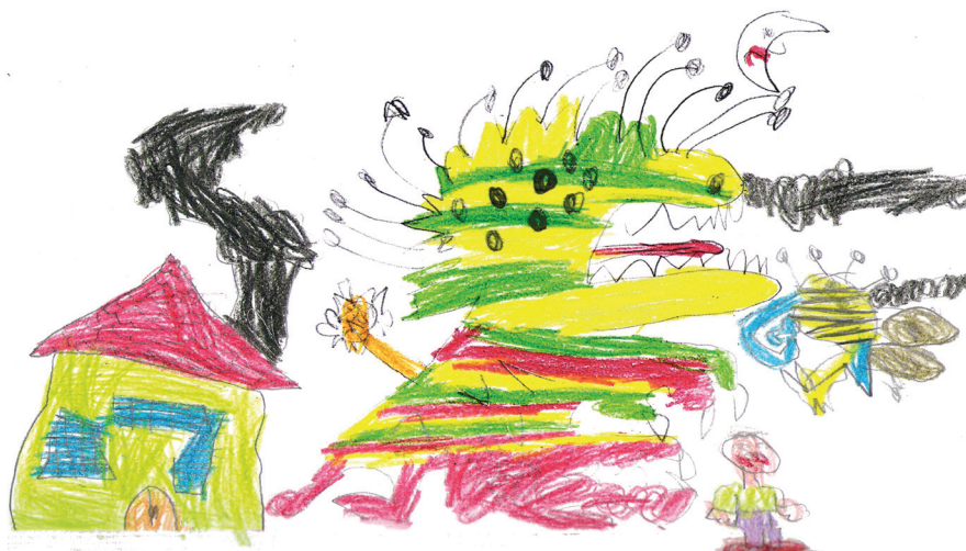
Figura 2. Dibujo de Iván (5 años) sobre la figura de un monstruo imaginado.

En primer lugar, es necesario señalar que no se observan diferencias de interés –ni en el plano gráfico, ni en el de significado– entre los dibujos recogidos en los dos colegios participantes en el estudio. Dicho esto, se recurre a las categorías del personaje monstruoso definidas anteriormente para reflejar los resultados obtenidos de forma conjunta (gráfico 1).