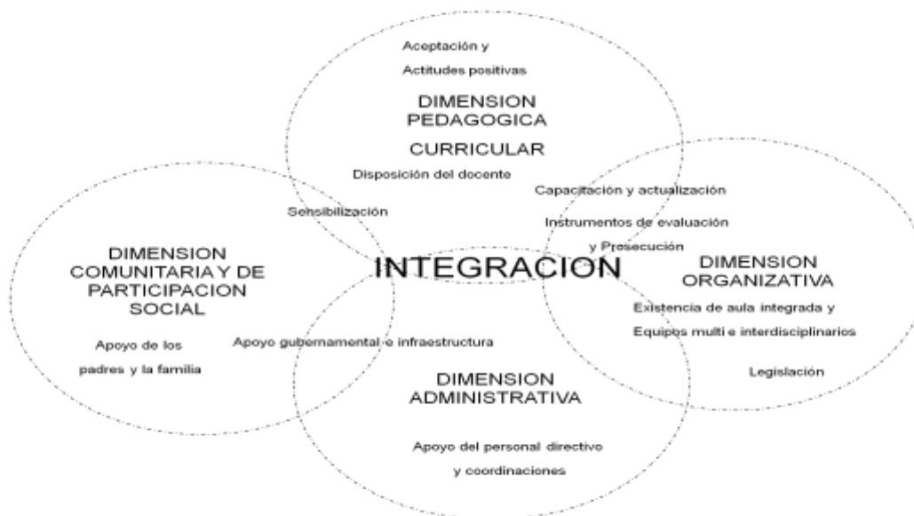
Figura 1. Modelo de Integración Educativa.

Esta modelación establece los vínculos entre los diferentes elementos, sin pretender cuantificarlos, sino comenzar a entender cómo actúa el sistema relacional. Se plantean las dimensiones en forma circular, considerando la pertenencia de los elementos a cada una de ellas, sin dejar de lado que los elementos no son componentes estáticos, sino que pueden involucrar a varias de las dimensiones.