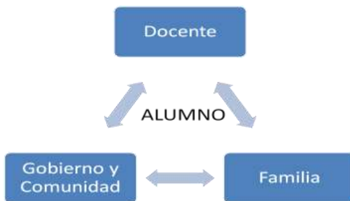
Fig. 2. Actores vinculados al proceso de integración Educativa.

La relación dinámica que se estableció en la primera modelación ha permitido destacar la presencia que da vida a la escuela, como lo son los agentes y actores involucrados en el proceso. Se presenta un esquema de participación en la figura 2: