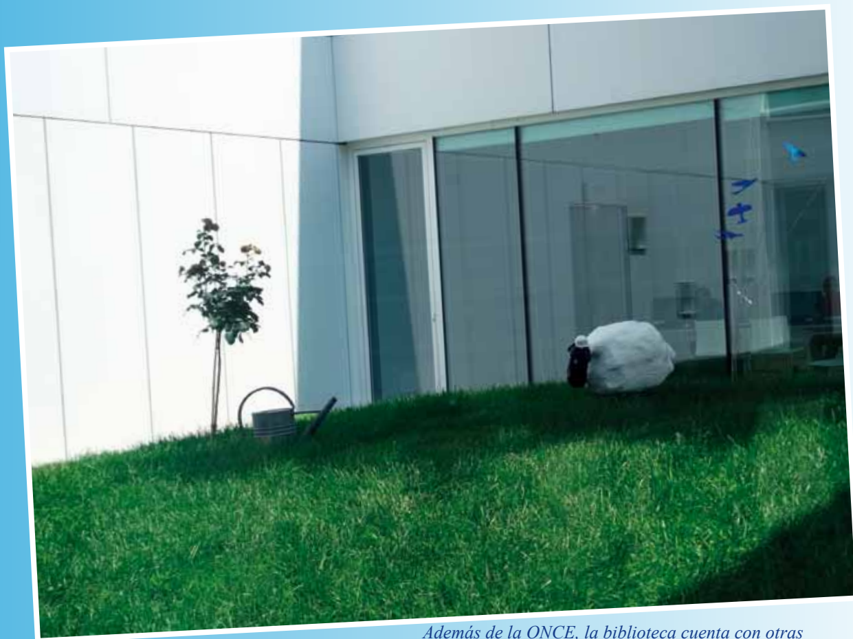
Además de la ONCE, la biblioteca cuenta con otras colaboraciones externalizadas, como las que gestionan los cursos de informática, el arte o las exposiciones temporales, como este homenaje a Saint-Exupéry.