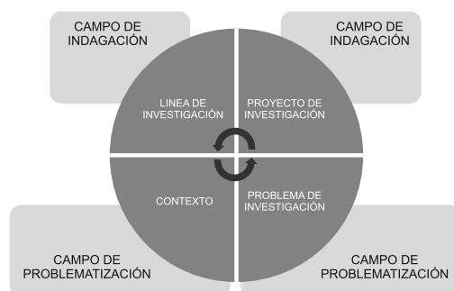
Figura 1. Modelo de definición de campo de problematización e indagación con direccionalidad inductiva

El tránsito de la noción de línea de investigación al concepto de campo de indagación: