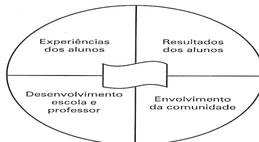
Figura 2. Um referencial para a melhora da eficácia escolar.

Conforme pode ser observado na Figura 2, o envolvimento da comunidade na escola é um dos fatores mais importantes do modelo de gestão compartilhada: