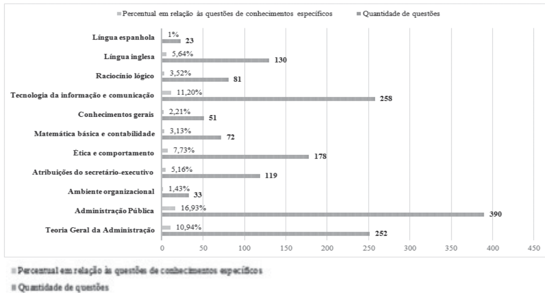
Gráfico 2: Enquadramento das questões de conhecimentos específicos nas categorias construídas

(BRASIL, 2005): “[...] gerenciamento de informações, assegurando uniformidade e referencial para diferentes usuários”. Das 2.304 questões de conhecimentos específicos, 1.587 (68,88%) puderam ser enquadradas nas outras categorias construídas, conforme demonstra o Gráfico 2: