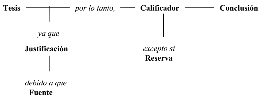
Fig. 1 - Elementos del modelo argumentativo de Toulmin.

En síntesis el modelo de Toulmin puede representarse de la siguiente forma: