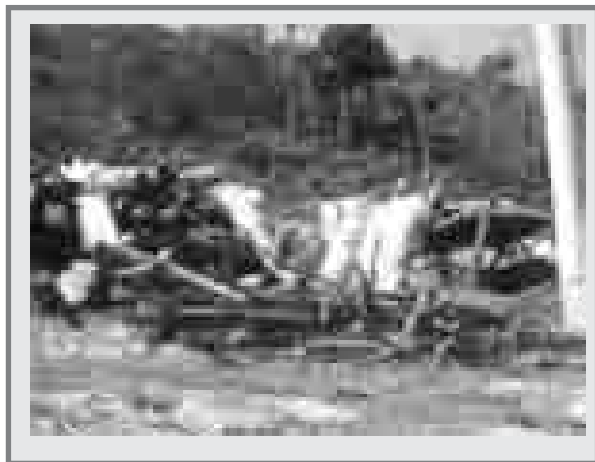
FIGURA 2. EXPLOTACIÓN DE LEÑA Y CARBÓN VEGETAL EN LA RESERVA FORESTAL EL ROBLEDAL.