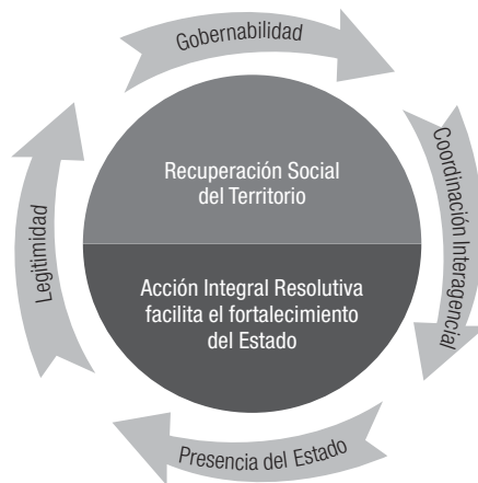
Figura 2. Acción integral resolutive