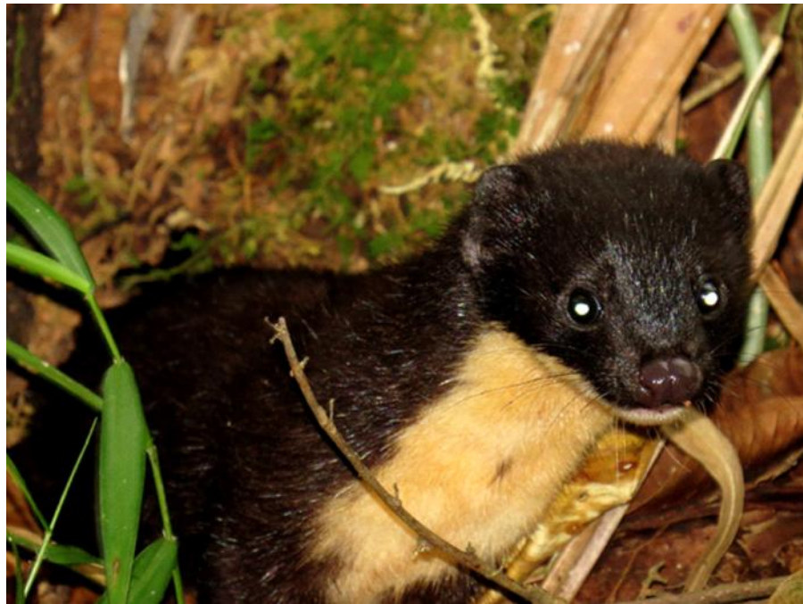
Figura 3. Ejemplar 2 de M. frenata fotografiado en la Finca La Macenia, Vereda El Roble, Filandia, Quindío. Se puede apreciar la ausencia de mancha gular conspicua y manchas faciales típicas de la congénérica M. felipei.