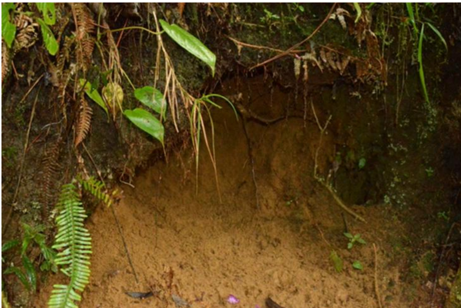
Figura 2. Entrada de la madriguera del ejemplar 1 de M. frenata fotografiado en los corredores de Barbas-Bremen.

una madriguera ubicada en raíz de un árbol con buen fuste y abundante hojarasca, líquenes y briófitos lo que la hace casi imperceptible. Este encuentro se dio el 11 de septiembre de 2014, a las 02:20 pm.