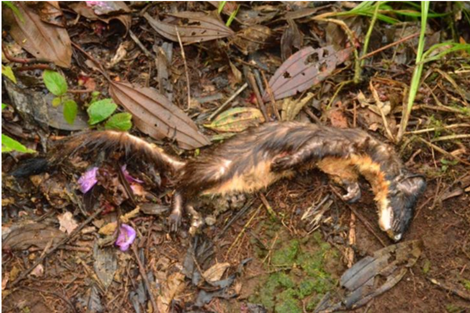
Figura 1. Ejemplar 1 de Mustela frenata registrado en los corredores de Barbas-Bremen, Filandia, Quindío, muerto por un perro fuera de su madriguera.