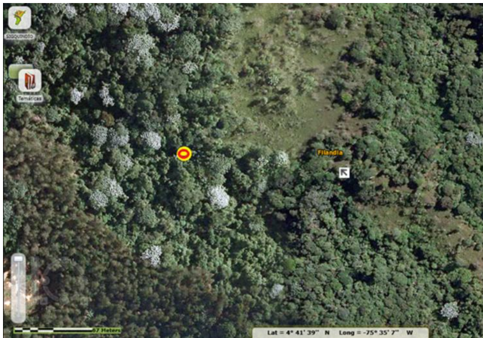
Figura 4. Fotografía aérea en la que se señala el lugar de la observación del ejemplar 2 de M. frenata proveniente de Filandia, Quindío (símbolo amarillo) y las características de la cobertura boscosa.

distribución de M. frenata se sobrepone en los Andes Centrales con la distribución de la comadreja colombiana M. felipei , especie más cercana en morfología externa (Ramírez-Chávez y Mantilla-Meluk