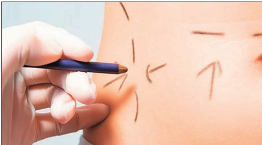
Figura N° 2: Cirugías estéticas en adolescentes deben hacerse previa evaluación.

En Estados Unidos también se busca regular la