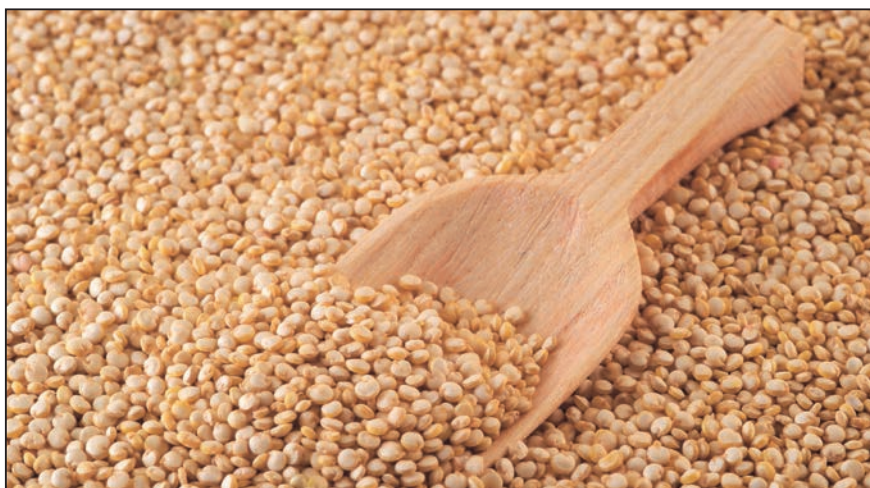
Figura N° 2: Granos de quinua.

En este caso la asociación a través de sus elementos en conjunto busca cumplir con las certificaciones internacionales para tener un mejor producto orgánico que satisfaga los altos estándares internacionales que justifiquen un mejor precio a la hora de negociar. Definitivamente contar con una certificación de Organicidad y de Buenas Prácticas Agrícolas determina una mejor capacidad de negociación con las empresas exportadoras o los compradores finales según sea el caso. Los mercados internacionales requieren el cumplimiento de las normas de comercio internacional para la exportación de productos