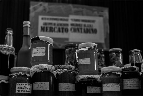
Productos artesanales de un mercado campesino en Calabria

allí donde las relaciones sociales preexistentes facilitan el intercambio entre productores y consumidores. Muchas de las iniciativas, y en particular el caso italiano presentado, surgen desde un proceso que inicialmente involucra movimientos locales, que se agrupan como asociación y, posteriormente, se expanden en su ámbito nacional inmediato.