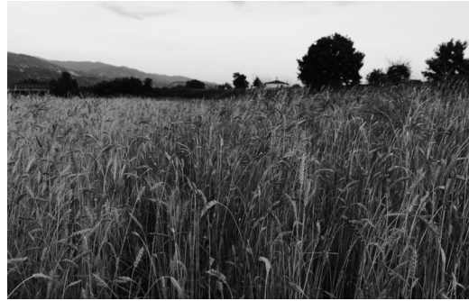
Cultivo de dos ecotipos de trigo antiguo (‘Gentil Rosso’ y ‘Senatore Cappelli’) en modalidad ecológica en el sur de Italia (Autora: Alessandra Corrado)

y consumidores con preocupaciones de consumo ético o agroecológico estén, de hecho, desconectados a pesar de su relación con la misma mercancía. En la Unión Europea, Estados Unidos y Japón, este sistema es el único institucionalmente reconocido (Velleda Caldas y Sacco dos Anjos, 2014). Si bien resultan ventajosos a la hora de llevar productos a los mercados de exportación, los sistemas de CTP son costosos, burocratizados y no reconocen diferencias entre tipos de productores o territorios. Así, un pequeño campesino – acostumbrado a un proceso de tutela de la agrobiodiversidad propio de las condiciones ambientales y e identidades territoriales de su región –, está sometido exactamente a los mismos estándares que un empresario que maneje varias hectáreas de producción orientada a la exportación. En el extremo, la CTP para actividades agroindustriales ha llegado a causar importantes conflictos locales (como en el caso de la certificación de plantaciones de árboles en Brasil).