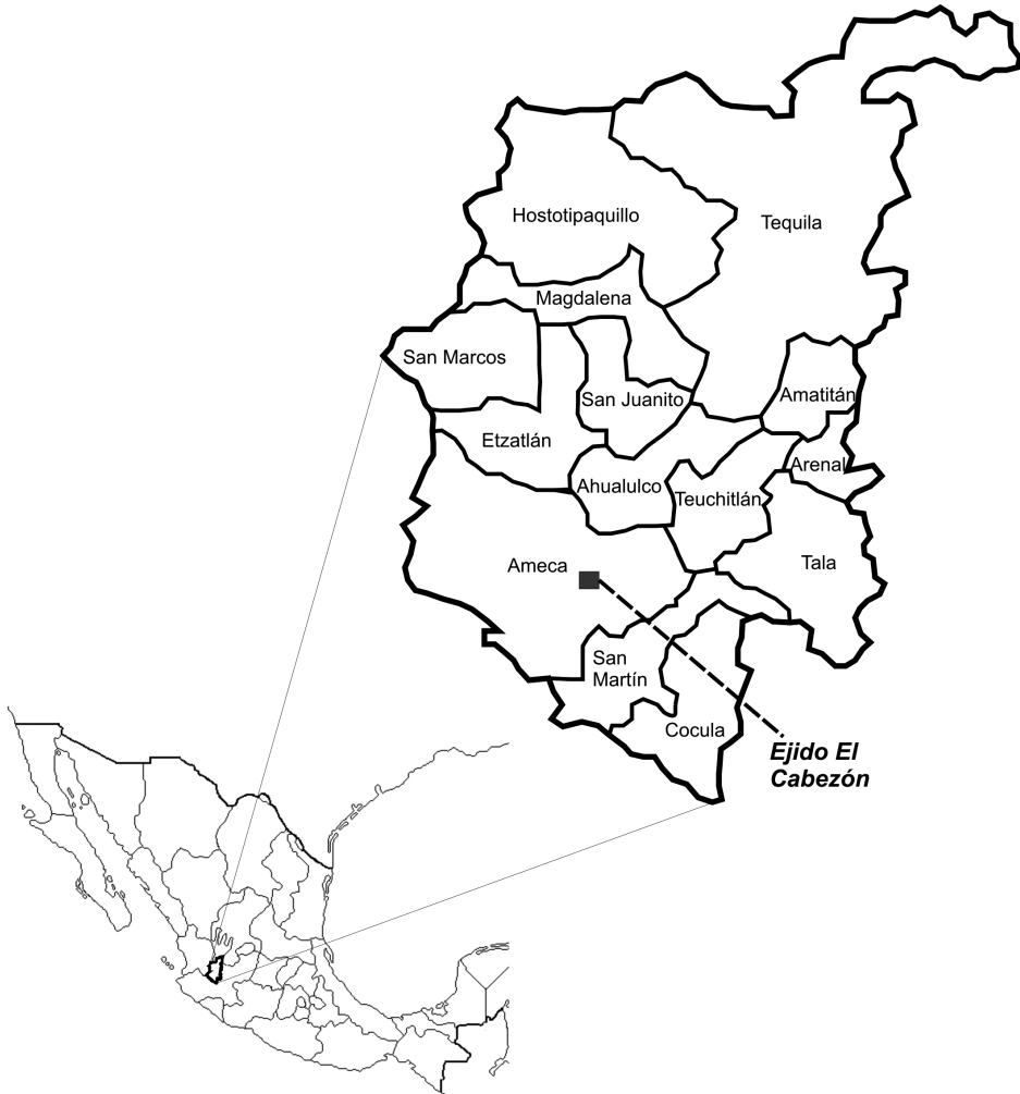
Mapa 1. Región IX, Valles de Jalisco