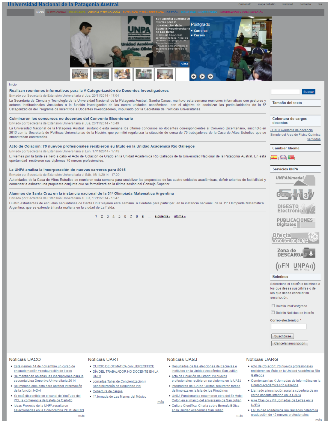
Figura 4. Página principal del Portal Web de la UNPA (rediseñada).

Como se puede observar en la Figura 4, una vez aplicados los cambios asociados a la incorporación de Patrones de Accesibilidad, la apariencia de la página Web se conserva tal como la original. Esto se debe a que las líneas de código fuente modificadas corresponden a metadatos de enlaces e imágenes que son percibidos sólo por un lector de pantalla o el uso del mouse (por ejemplo, Texto Alternativo al posarse encima del objeto). En el ANEXO I se describe el código HTML que produce cada una de las barreras de Accesibilidad identificadas, y el cambio realizado (resaltado en negrita) para poder derribarla, basándose en los Patrones de Accesibilidad.