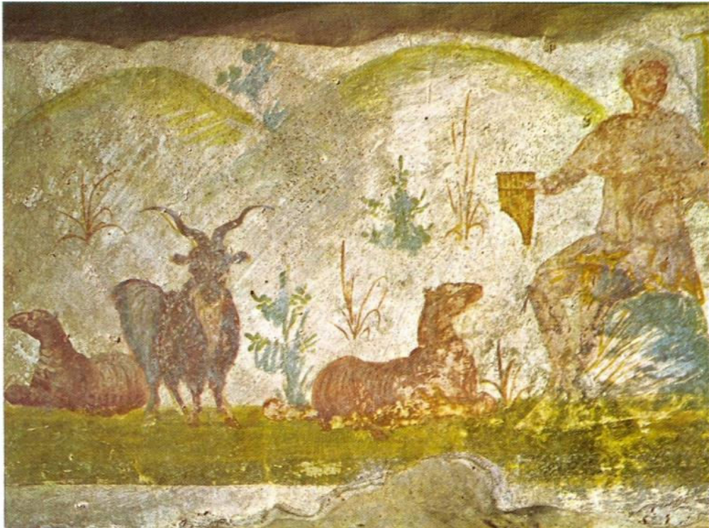
O Bom Pastor no paraíso . Século IV. Pintura sobre reboco. Motivos simbólicos tradicionais da Igreja Cristã, se mesclam a elementos pagãos.

A partir do século III, a figura de Cristo torna-se barbada, fazendo referência a um professor, ou um equivalente dos filósofos gregos. Ele “está vestido com uma camisa branca, e a veste sobre ela também é branca. Usa sandálias, detém um pergaminho em sua mão esquerda, ao mesmo tempo, a mão direita está