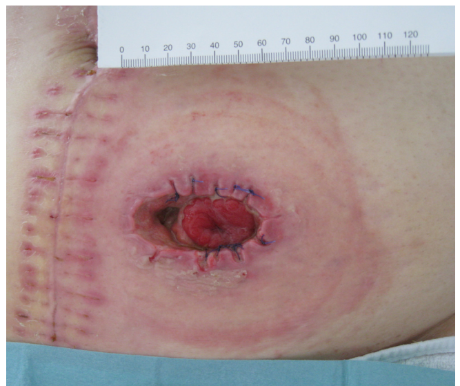
Imagen 8. Aspecto del estoma y piel circundante (18 días).

En el caso de la dehiscencia, se produjo por separación parcial del asa intestinal de los puntos de sutura. Es una complicación frecuente que suele aparecer en la primera semana del post