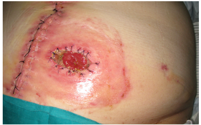
Imagen 2. Fibrina en dehiscencia y piel pericostómica enrojecida.

Pasados cinco días (25/11/14), unos 19 días después de la intervención quirúrgica, se logra estabilizar la fuga de la colostomía, la piel pericostómica aparecía con mejor aspecto y la dehiscencia del estoma presentaba tejido de granulación (Imagen 8) . Se continuó con el mismo procedimiento de curas y control de evolución.