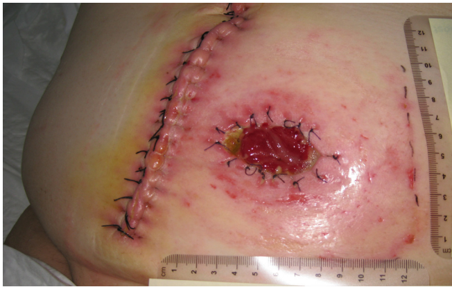
Imagen 1. Dehiscencia en estoma y dermatitis periestomal.

dehiscencia de reciente aparición en el margen inferior del estoma.