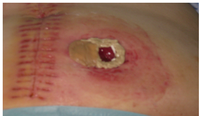
Imagen 5- Aplicación de pasta moldeadora y resina para estomas.