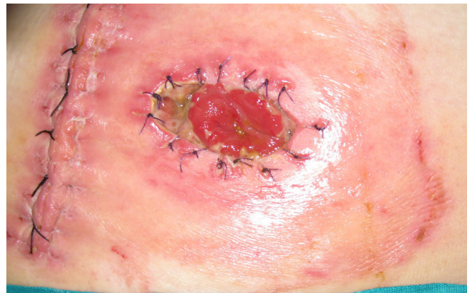
Imagen 3. Protección piel pericostómica con película barrera de silicona.