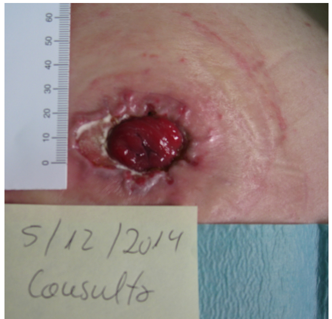
Imagen 10- Aspecto del estoma tras 3 días del alta.