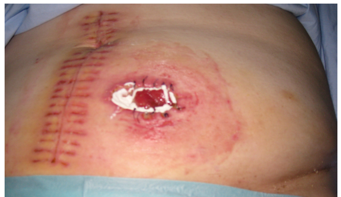
Imagen 4. Hidrofibra y polvos para estoma en zona de dehiscencia.