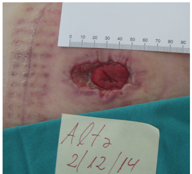
Imagen 9. Aspecto del estoma al alta hospitalaria.