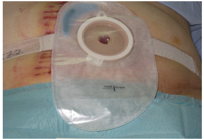
Imagen 7. Dispositivo de bolsa de colostomía y cinturón de sujeción abdominal.

El día 2/11/2014, tras 25 días de hospitalización la paciente recibe el alta hospitalaria con un informe de alta de continuidad de cuidados y seguimiento por la consulta de ostomía. La dehiscencia en ese momento se encontraba en fase de remisión y cicatrización parcial (Imágenes 9 y 10) .