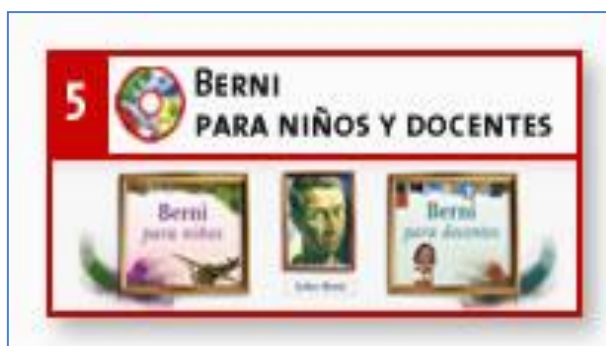
Imagen de la portada del CD N° 5: Berni para niños y docentes. 5

En el portal Educ.ar también podrán encontrarse otros interesantes materiales educativos vinculados a la educación artística como por ejemplo el CD N° 29 sobre Arte argentino para trabajar en el aula ( http://coleccion.educ.ar/coleccion/CD29/contenido/index.html ) o el minisitio Arte Argentino ( http://arteargentino.educ.ar/ ). En Educ.ar también se hallarán enlaces a museos virtuales de Argentina y el mundo, propuestas por demás interesantes para la educación artística.