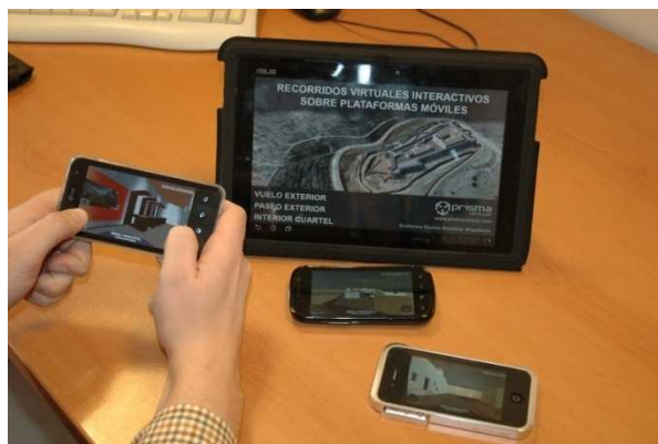
Figuras 3 y 4. Dispositivos móviles con el recurso implementado.

Versión beta aplicada al castillo de San Marcos (Sanlúcar de Guadiana, Huelva)