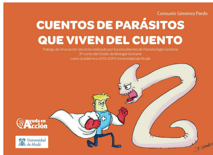
Figura 2. Portada del Libro de cuentos

En esta experiencia educativa hemos trabajado los cuentos porque éstos además tienen el aspecto importantísimo de permitir la transmisión de valores. Este libro, ya editado, está a disposición de todos los colegios españoles que participan en el Programa “Ahora Toca” y también de los países de América (Bolivia, Colombia, Ecuador, El Salvador, Honduras, México, Nicaragua, Paraguay y Perú) donde trabaja AeA, con el fin de que lo puedan utilizar niños y maestros http://programaeducativo.ayudaenaccion.org/2013/12/13/cuentos-de-parasitos-que-viven-del-cuento/