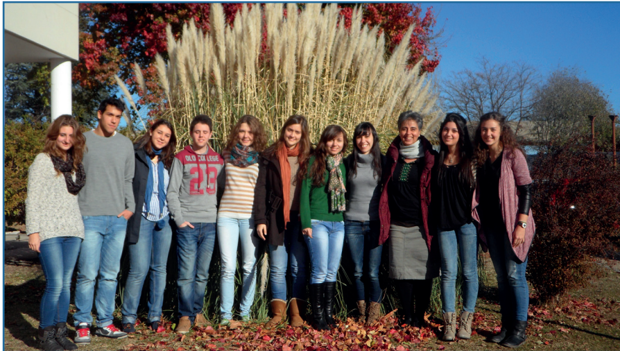
Figura 3. Los estudiantes que han participado en el trabajo con su profesora